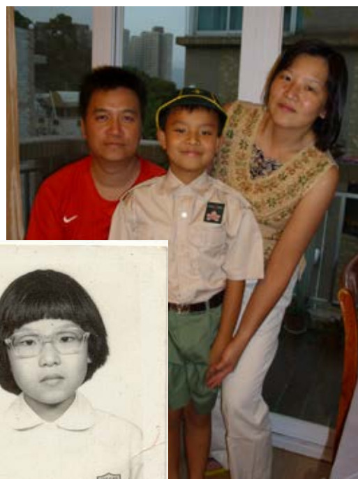
和先生及同樣是小馬學生的兒子合照。

對以上種種變遷，我真的感到極之欣喜，還可以驕傲地對別人說：我以馬頭涌官立小學畢業生為榮！