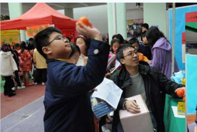
看他這麼專注, 一定會中的！