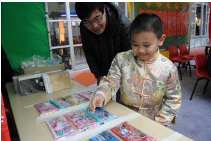
每件獎品都這麼精美, 不知如何選擇？