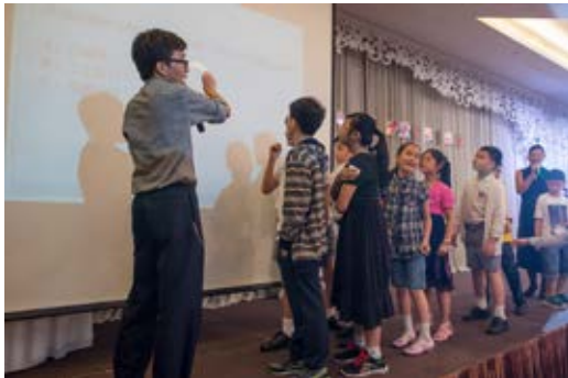
同學們踴躍參加遊戲比賽。