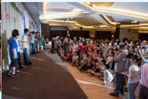
原來他們有很多粉絲啊！