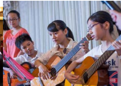
結他班的同學專注地演出。