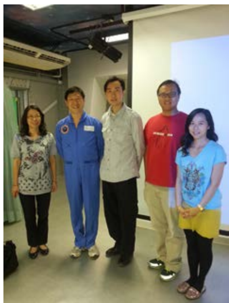
雷健泉先生與雷鍵敏校友、張玉珍主席、簡焯傑顧問及曾韻儀老師合照。

校友會於2013年10月26日下午在母校禮堂舉行了“中國航天新導向”講座，榮獲香港航天學會會長雷健泉先生為我們主講。當天，除了校友會的會員出席外，亦有在讀同學和童軍一同參與。