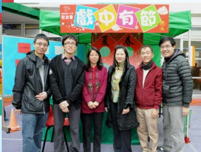
校友會委員及顧問合照。