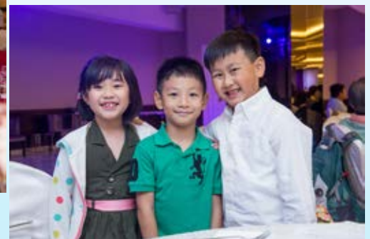
天真的笑容總是最燦爛、最美麗！