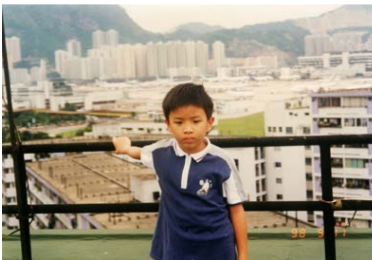
在天台遙望啟德機場後拍照留念。

最後，我謹希望在這兩年的任期內，在黃校長、各位老師、校友會主席及各位顧問的引領之下，與全體常務委員一起把校友會的會務「做得更好」，以答謝母校當年培育之恩！