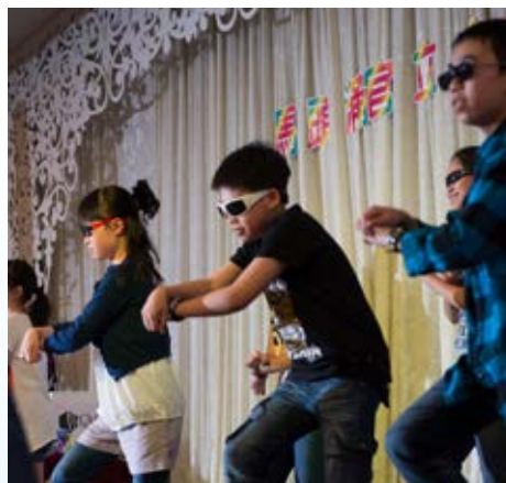
你看他的「騎」姿多有型！