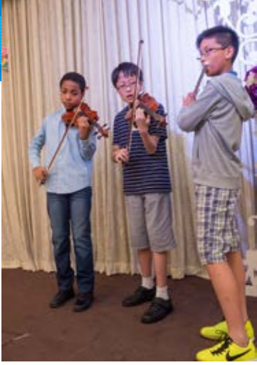
三位同學吹奏出美妙樂章。