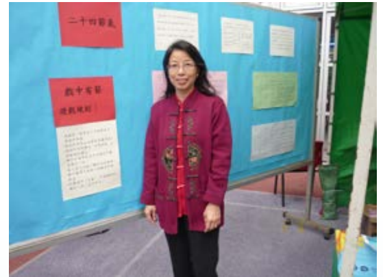
拍攝於2012中華文化日校友會遊戲攤位前。