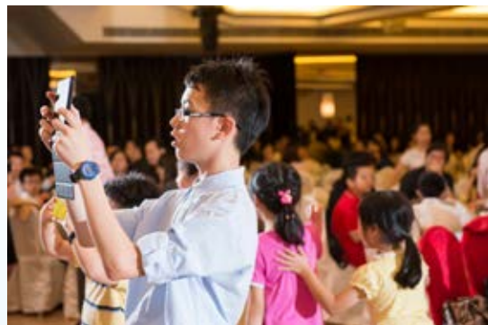
你看他多專注地為演出的同學拍攝！