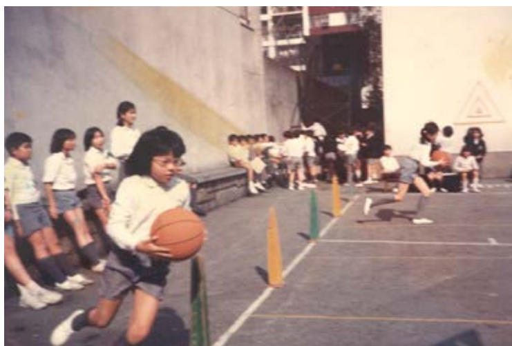
當年我的籃球技術可不錯呢！

同學們一窩蜂走到操場，各自走到自己想去的地方 - 我當然是快快跑到操場（現時的男洗手間門外）去玩跳飛機喇！