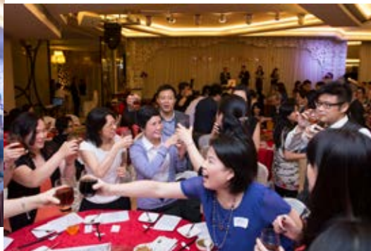
席上嘉賓互相祝酒言歡。