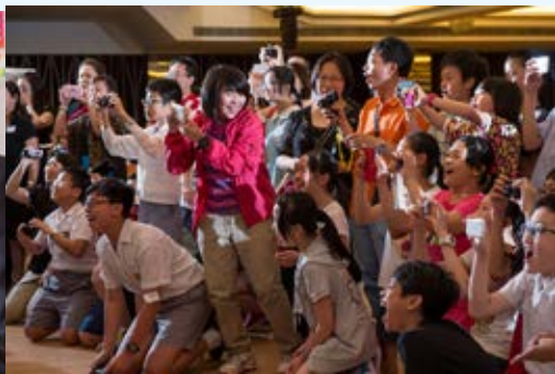
臺上的演出一定很精彩啊！