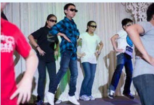
這位同學真有韓星風采啊！