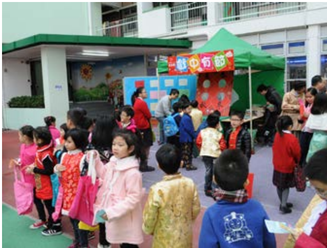
校友會的攤位遊戲很受歡迎啊！

校友會於2012年1月首次參與母校每年一度的"中華文化日", 為學弟妹們設置了一個以中國二十四節氣為主題的攤位遊戲, 喻學習於遊戲當中, 深受歡迎。