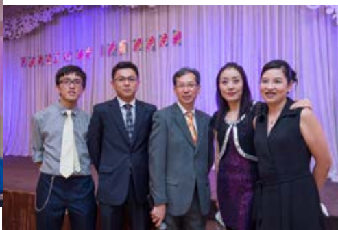
是晚表現非常出色的司儀團。