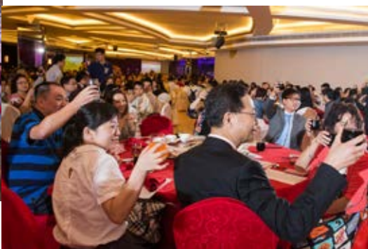
席上嘉賓舉杯向臺上主禮嘉賓祝酒。