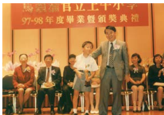
拍攝於(1998)二年級畢業禮上。