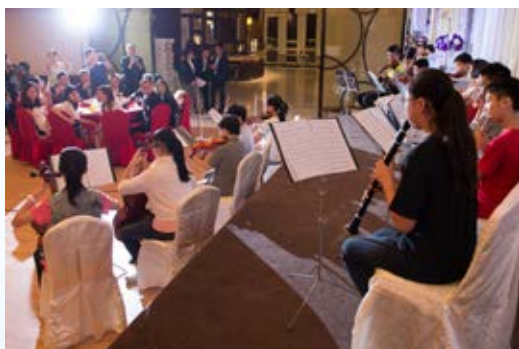
席上嘉賓細心欣賞管弦樂團的精彩演奏。