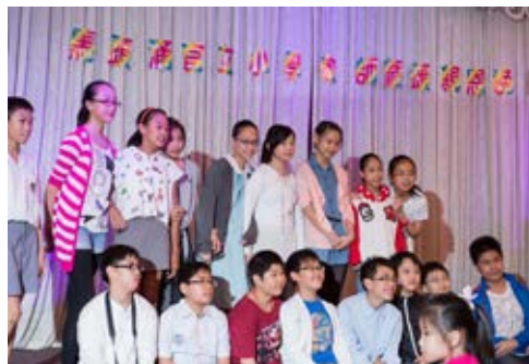
剛畢業的同學在入席前先來張大合照。