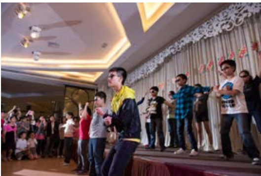
一班「韓國大叔大嬸」也來為晚宴演出。