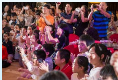
臺下的觀眾都看得十分開心。