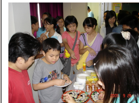
校友們一邊享用美食、一邊談談近況