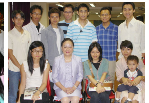
已離校十載的校友聚首一堂