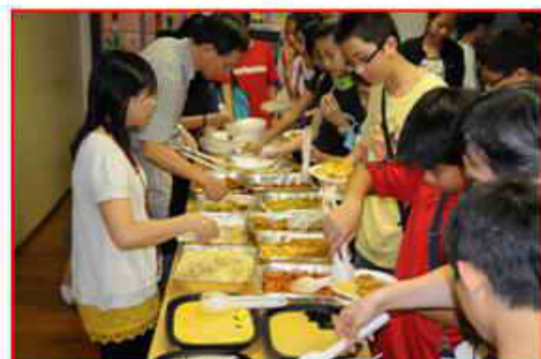
在大會完結前一齊享用精美茶點