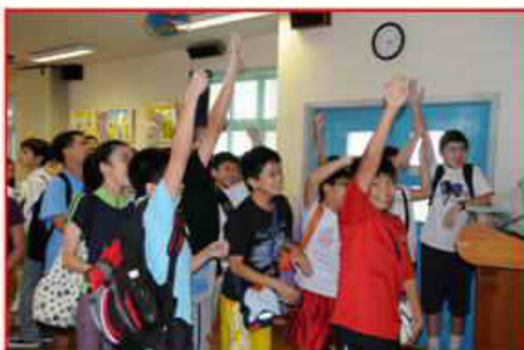
校友們都踴躍參與大會的遊戲