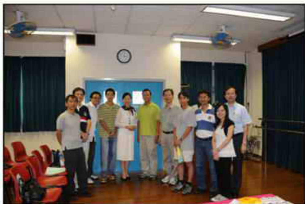
去屆及新一屆委員與黃校長合照

秉承校友會的宗旨，發展一個平台給各位校友，不論是同屆或不同屆別畢業，都能夠互相認識，保持校友與校友之間，及校友與母校的聯繫。所以展望未來兩年，除了會如常為較年幼的校友舉辦一些活動之外，更會誠意推出一些專為畢業年份較早的校友的活動。藉著這些活動，您們可以從新認識今天的母校，及和您多年不見的‘小朋友’重溫當年在母校讀書時的片段。希望到時能夠見到您。