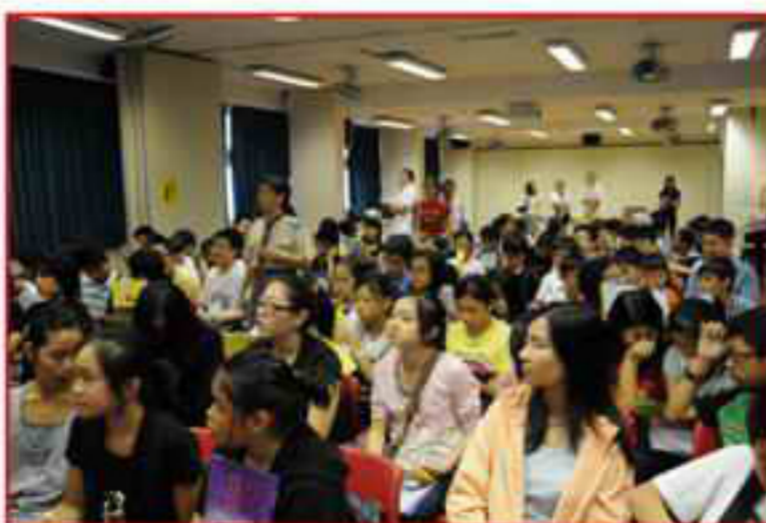
大會當日真的是座無虛設呢