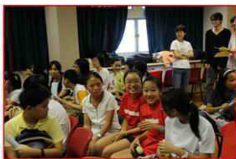
出席的校友都在有說有笑