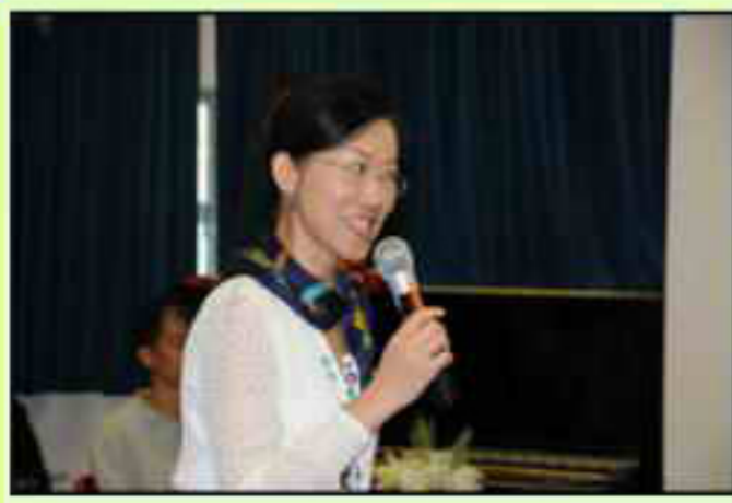
黃校長在週年大會上發言

在去年聖誕的早上，我懷著既興奮又緊張的心情到酒樓與一位失去聯絡三十多年的小學同窗見面。大家見面時，才發覺彼此已由昔日丫角之年轉為鬢角已有風霜之貌。寒暄底下，彼此都覺得若昔日有校友會來連繫我們，就不用到處打聽，周圍尋訪大家了，也不用多年後才能重聚。