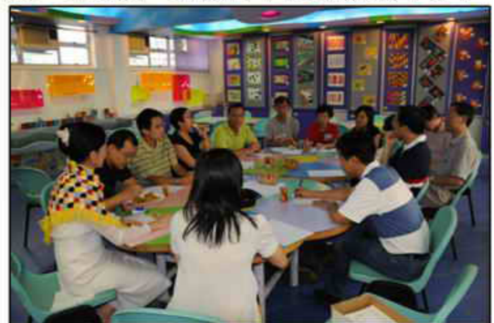
第四屆校友會委員與黃校長開會合照