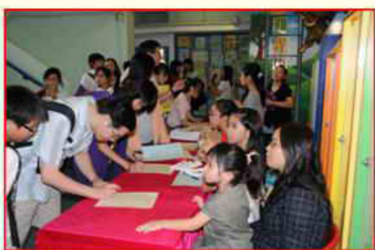
各校友在大會開始前進行入場登記

一年一度的會員大會已於今年九月二十七日順利舉行。出席人數達到 114 人。在新任校長黃玉貞女士及去屆主席簡偉傑先生致詞後正式開始。當各項報告完成後，便開始選舉新一屆的委員。由於今次是等額選舉，所以十三位候選人都自動當選。緊隨之後便是遊戲活動，其間各會員都踴躍參與，氣氛十分熱烈呢！最後大家在享用完豐富的茶點之後，大會便完滿結束了。