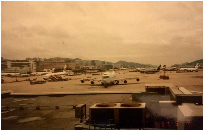
筆者於1997年於 機場客運大樓眺望北面停機坪一攝， 圖中的左方約為現時德朗邨之位置。

後記： 長居於九龍城或土瓜灣一帶數十年的街坊，不論是喜歡或是不喜歡舊啟德機場的，相信也不會忘記與她相處過的一段長時間。筆者每天上下班乘車經過協調道（舊機場後勤區），凝望著如今啟德的一片滄海桑田，心裡由衷地期待著發展區內各項基建項目早日落成，為本區帶來新動力和新氣象。