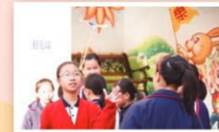
我的直昇機飛上天了。