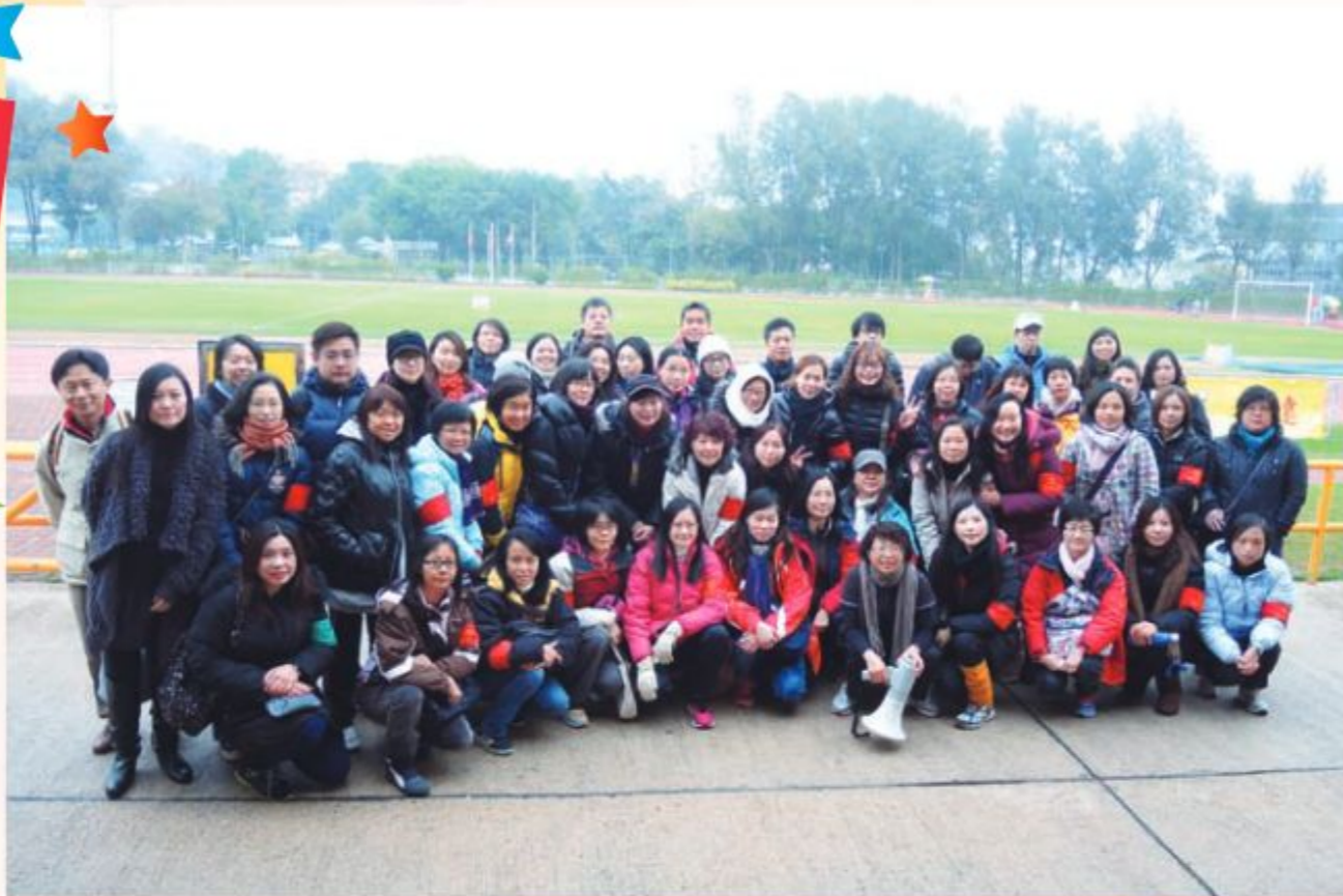
校運會的龐大家長義工隊伍