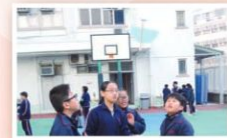
「這個高度未夠高利，我們再努力嘗試。」