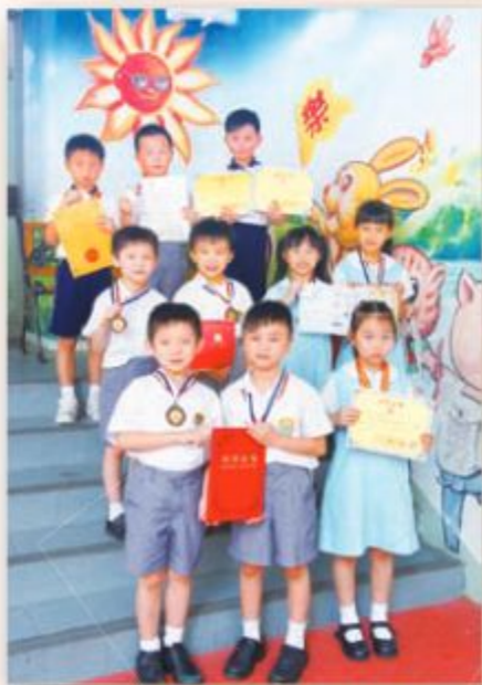
一、二年級得獎同學合照