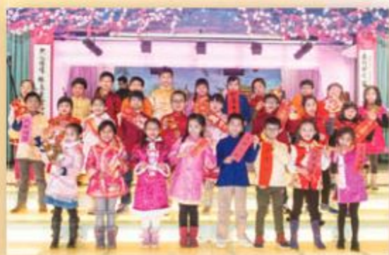
合唱團也來高歌一曲！