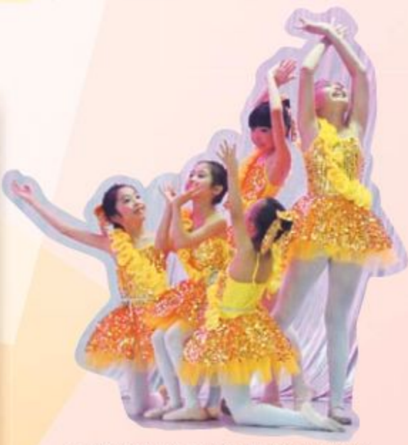
舞蹈組同學參加北京舞蹈學院中國舞等級考試課程隊際賽（四至六級）榮獲金獎。