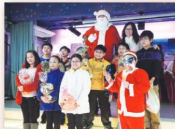
得獎同學與黃校長及聖誕老人來一張合照。