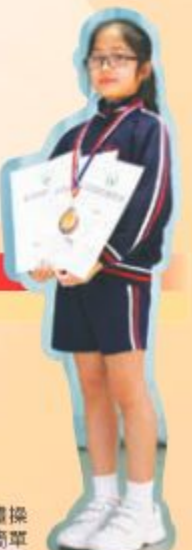
佩怡藝術體操技巧殊不簡單