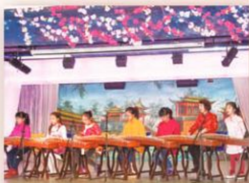
學生的古箏演奏，贏得各人熱烈的掌聲。