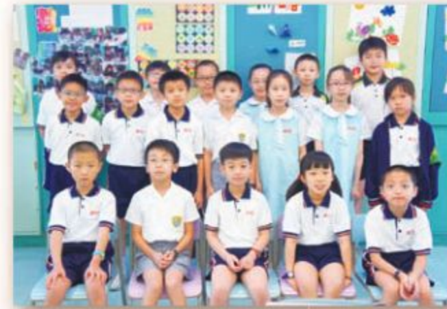
小三年級數學精英培訓班同學合照