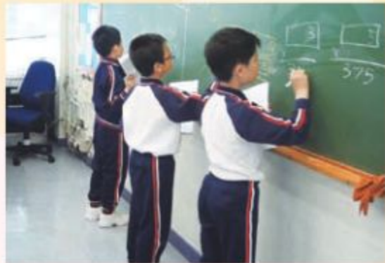
高年級奧林匹克數學培訓班