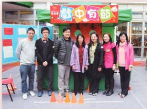
校友會積極參與母校一年一度的「中華文化日」活動，攤位遊戲以「中國廿四氣節」為題。