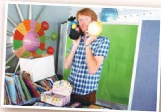
Mr. Tom has a lot of gifts. Come to play and get the gifts.