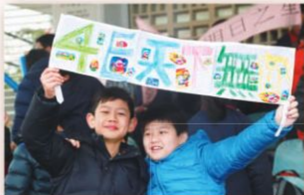
看！我們的啦啦隊多投入！