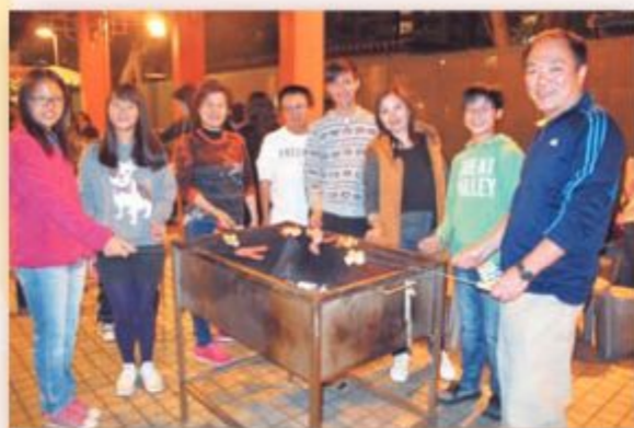
校友、家長、老師共聚一爐，樂在其中。