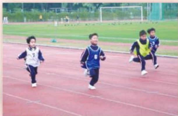
每位健兒都拼盡全力，做到最好！