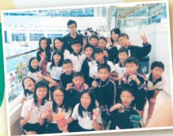
隊員們勇奪多個獎項，興奮之情難以言喻！