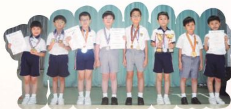
本校的跆拳道小子