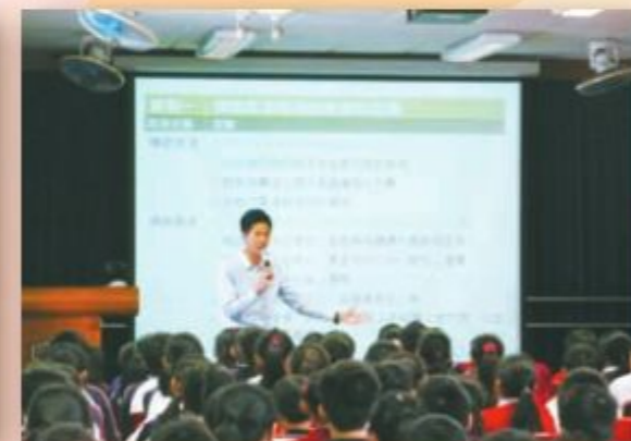
分別為小五及小六學生舉行「青春期心理生理衛生」講座及「如何防止網上欺凌」講座。