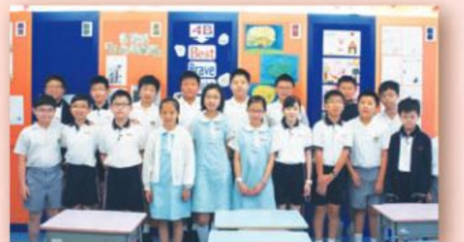
小六年級數學精英培訓班同學合照