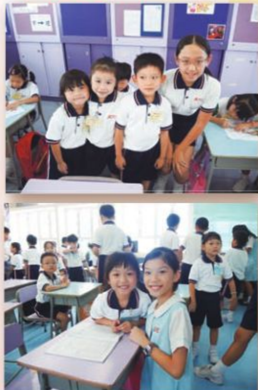
六年級的哥哥姐姐利用小息時段，指導小一弟弟妹妹常規，解決他們學習上的疑問及校園生活瑣碎事。