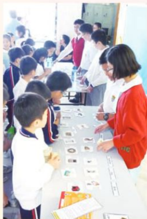
Students love the 'English Day' very much.

This year, I upgraded the P6 Interview Skills workshop during term 1, working with local colleagues and our friends at the EDB NET Section. We focussed on group interviews and, with the assistance of other NETs, simulated group interactions in preparation for the P6 secondary school entry interviews. As usual, the visiting NETs remarked that the efforts and standard of English demonstrated by children at Ma Tau Chung is well above average.