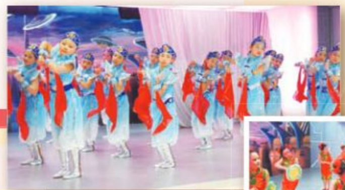
舞蹈精英 A 表演《草原女孩》獲得校際舞蹈節優等獎。

本 校學生除了參與校內不同的比賽外，亦參加多項校外比賽，無論在舞蹈、藝術體操、視藝、棋藝、國術、跆拳道、寫作及朗誦等均表現出色，獲獎纍纍。