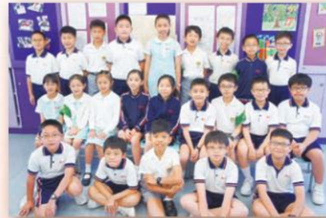
小四年級數學精英培訓班同學合照