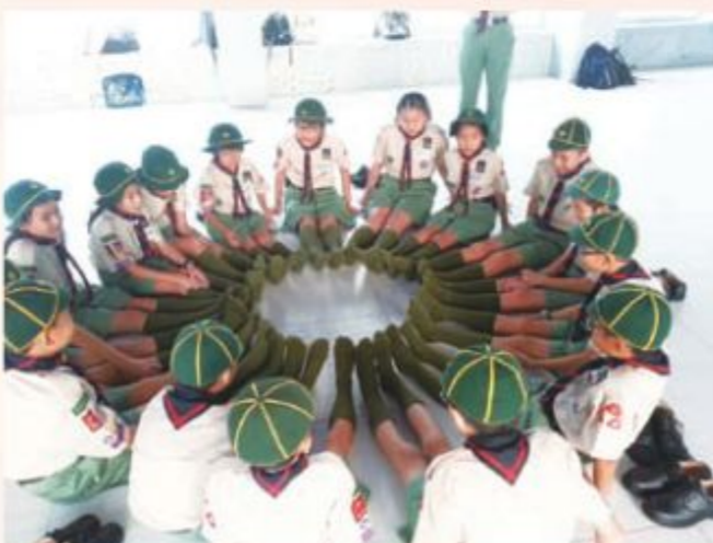
團結就是力量 (隊長及副隊長訓練)

本旅開辦童軍團已進入第十三年頭，今年有一大喜訊，就是本旅開枝散葉，正式擴展童軍團。今年度除招收剛畢業的幼童軍，亦招收過往已畢業的校友童軍。過去一年，多謝黃玉貞校長鼎力幫忙，才能順利成立童軍團。而本旅畢業的幼童軍常嚷着「要回家」，今次如願以償，令大家對學校旅團更有歸屬感。希望 1272 旅能一直承傳下去，薪火相傳，發光發熱。回家是最好的，家可以給你溫暖、安全，為你擋風擋雨。我們會傾盡全力，悉心栽培童軍們成為良好公民、優秀的童軍和未來旅團接班人，為學校、為旅團爭光，為社會作出貢獻。童軍加入本旅殊不簡單，他們要經過四年的幼童軍生活，並考到幼童軍最高榮譽金紫荊獎章，才可以加入童軍團。