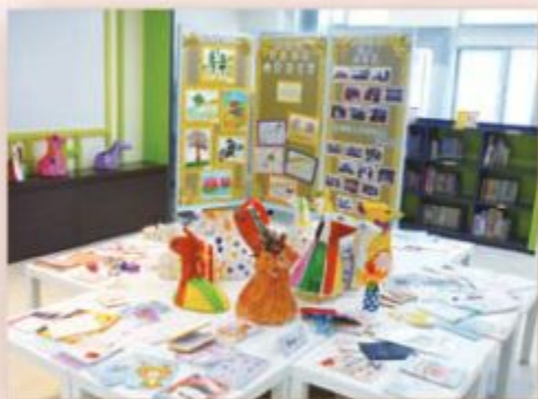
小書展覽盡顯學生的創作才華。