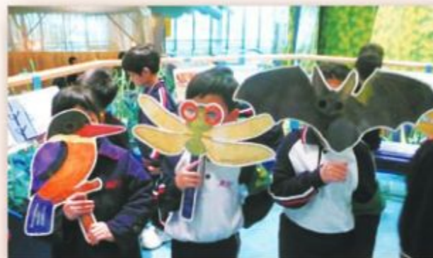
同學們在「兒童探知館」學到不少課外知識。