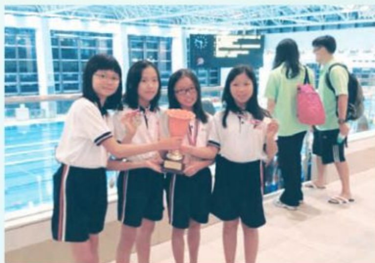
泳隊奪得女乙團體亞軍。