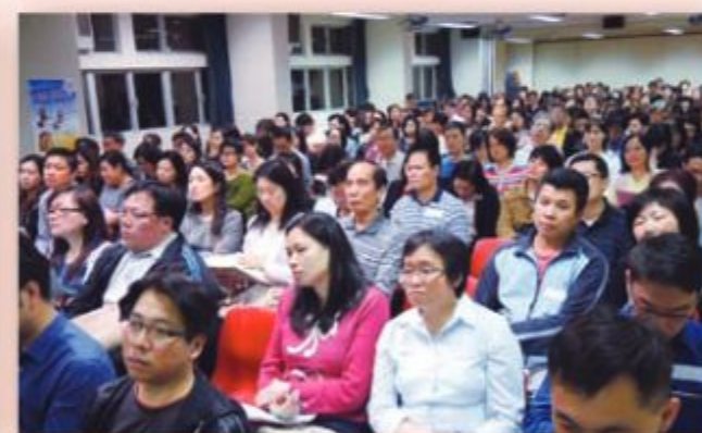
家長積極參與家長天地