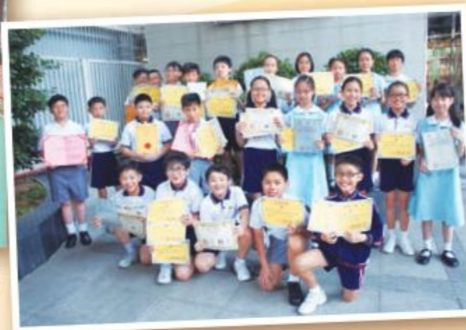
五年級得獎同學合照