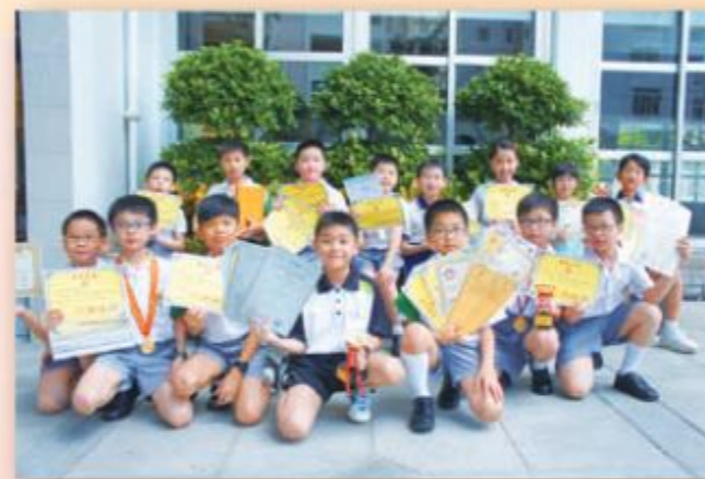
四年級得獎同學合照