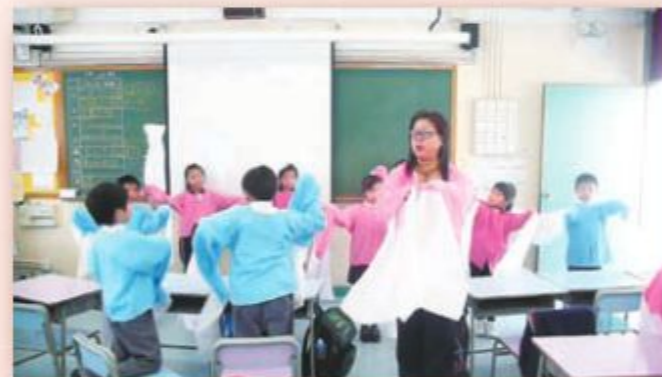
揮動長長的水袖，就像跳舞一樣！