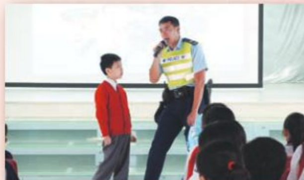
交通部的警員向四年級的同學講解道路安全守則。