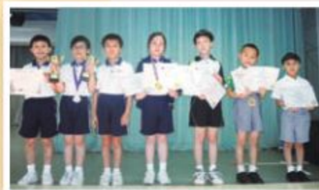
繪畫是他們的強項呢！