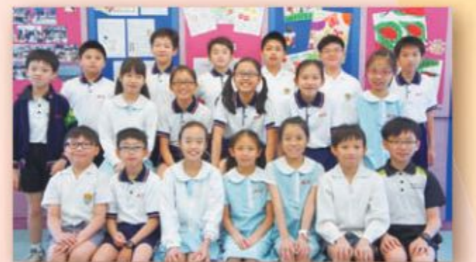
小五年級數學精英培訓班同學合照