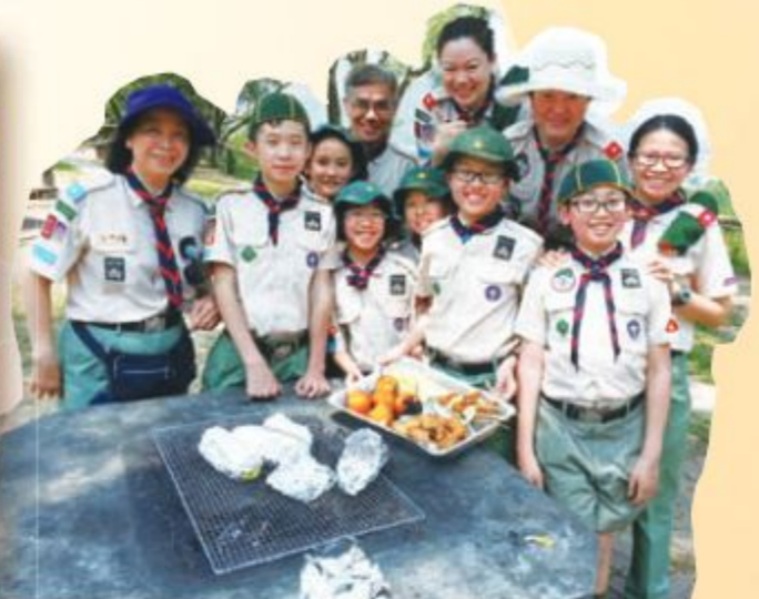
分甘同味 — 原野烹飪活動

別得到亞軍及殿軍。其他活動方面，包括足球訓練班、原野烹飪、參觀香港飛行總會、公園定向訓練班、隊長隊副訓練等。