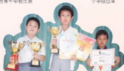
你們有膽量挑戰棋藝高手嗎？