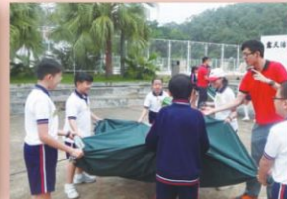
在歷奇活中，同學們明白到團結的力量。