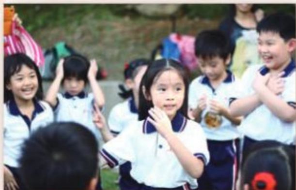
看！低年級同學正參與集體遊戲。