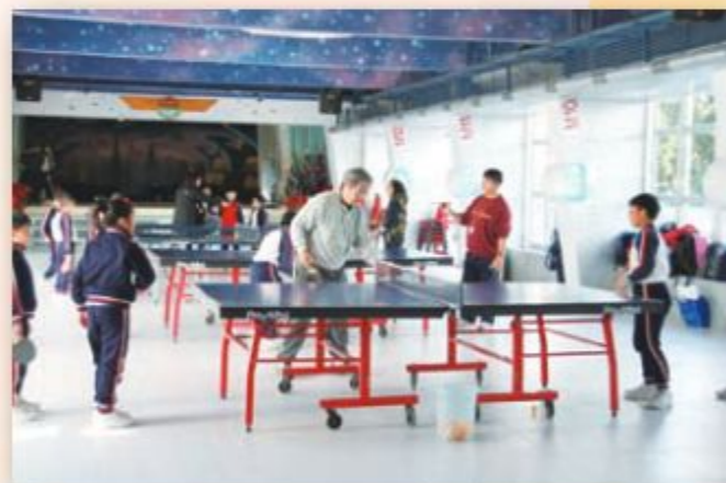
家長於週三課外活動擔任導師 — 乒乓球組