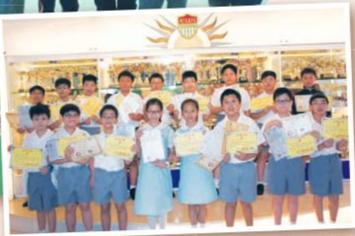
六年級得獎同學合照