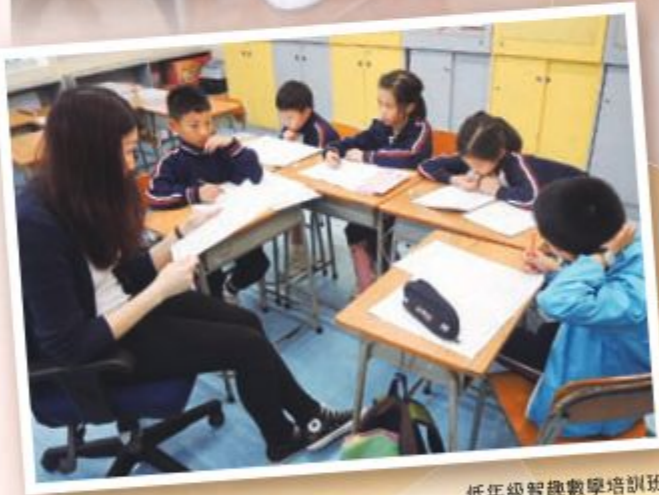
低年級智能數學培訓班