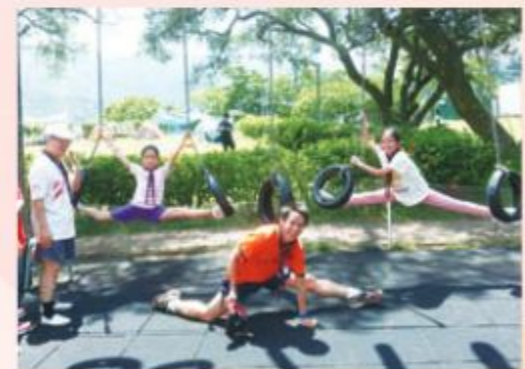
幼童軍大破網陣 (大潭露營活動)

本旅希望童軍們透過富挑戰性而又歡愉的活動，發展五育，茁壯成長，所以去年舉辦了全旅大宿營。在剛過去一年，本旅有 10 位幼童軍通過各項金紫荊獎章考核，成功考取到金紫荊獎章。