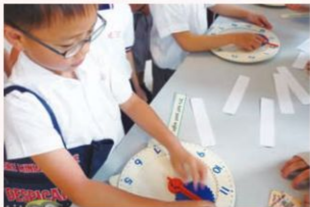
Students tried their best to play the games.

透過活動去學習不但令學生有更多的樂趣，更重要是能讓學生樂於學習；如能啟動了學生的學習興趣，他們便會更積極主動去學習，因此，英文科、普通話科及常識科等都定期舉辦活動，讓學生在愉快的氣氛中主動學習。