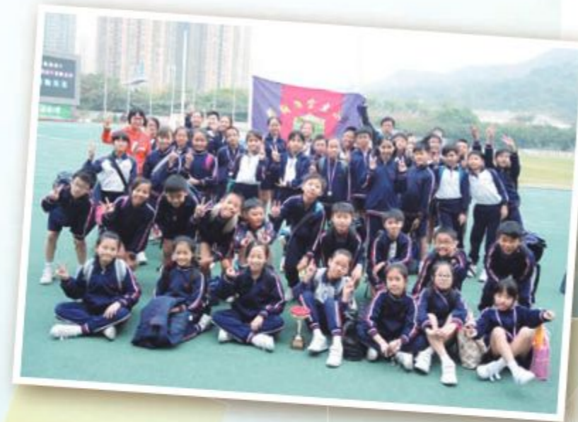
老師和參加九龍小學校際田徑賽同學的大合照

本校學生對田徑和球類活動有濃厚的興趣，他們皆踴躍地參加各項有關的比賽，並積極練習，以奪取多個獎項。