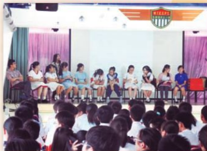
一班師兄師姐們暢談精采的中學生活。