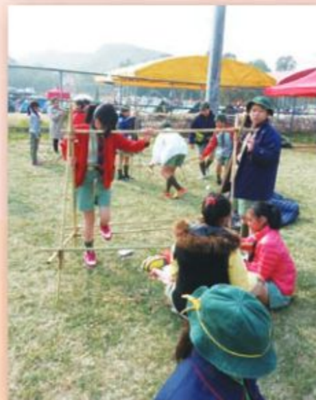
他們就是我們幼童軍的工程小先鋒 (金紫荊獎章考驗營)