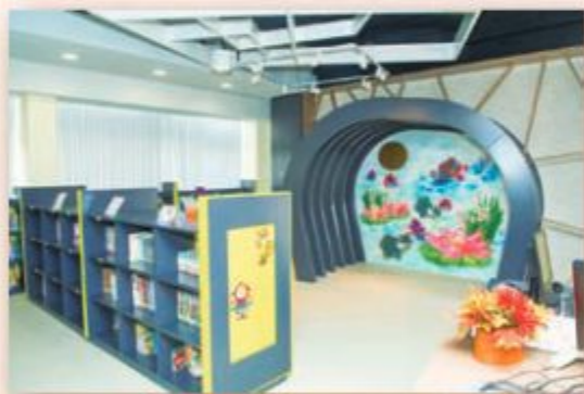
圖書館新貌盡顯中國亭苑特色。