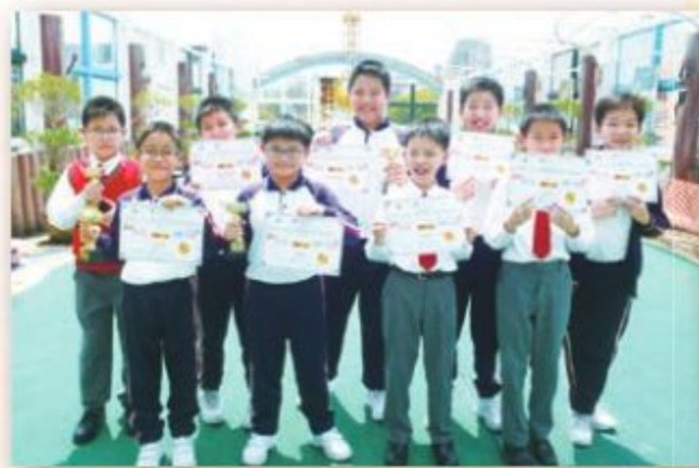
2013-2014 年度全港十八區小學數學比賽 (九龍城區) 得獎同學合照