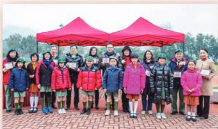
黃校長和嘉賓來一張大合照。