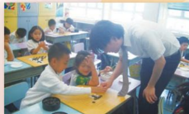
想清楚沒有，這一步棋，真沒錯？！