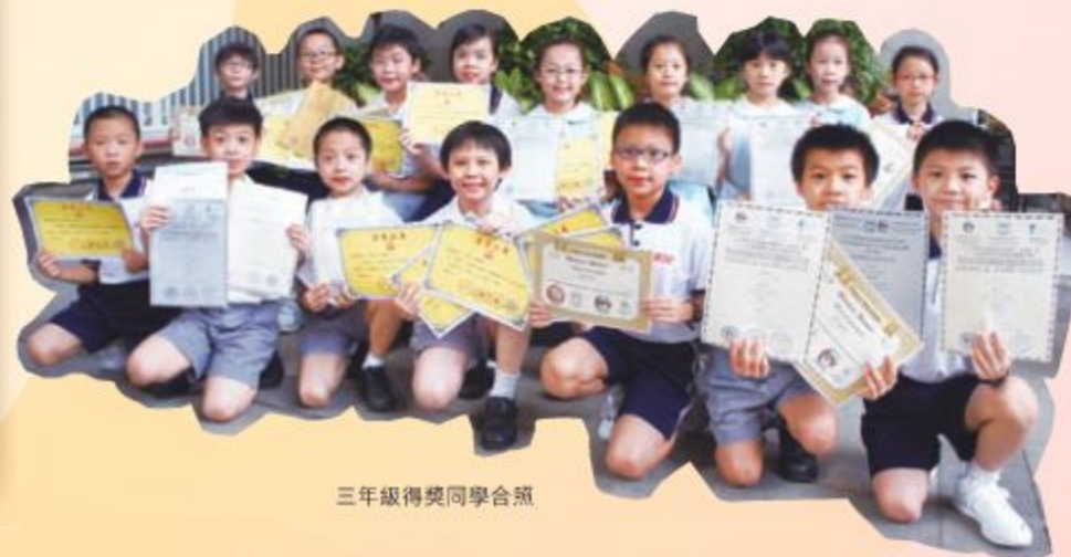
三年級得獎同學合照