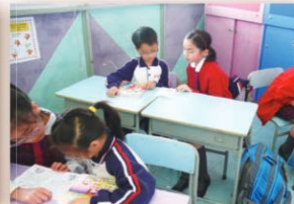
在「小老師」的陪伴下，同學更喜愛閱讀。