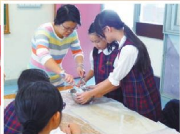
家長於週三課外活動擔任導師 — 循環組 (小小大廚師)