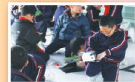
齊齊合作剪剪貼貼，針孔照相機就可完成了。