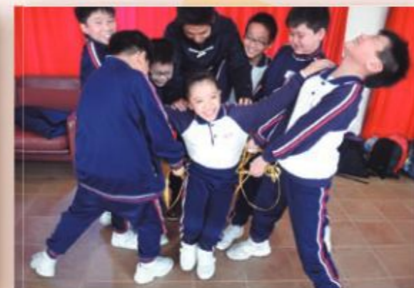
透過訓練營，培育學生與人相處及上網的正確態度，傳播使用網絡的正面價值觀。