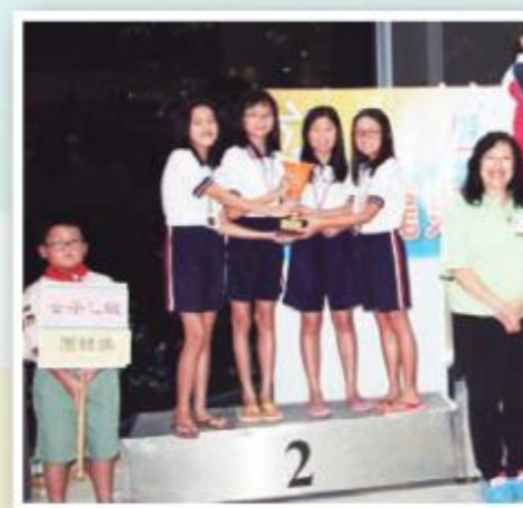
泳隊奪得女子乙組團體亞軍。