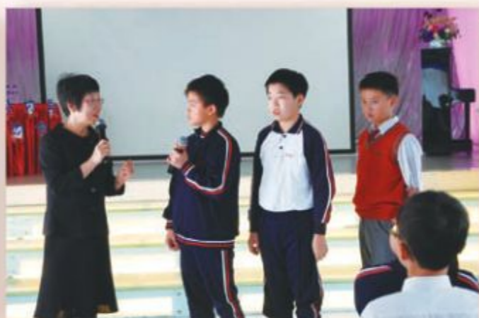
何歐佩嫻校長為學生解答有關升中的疑問。