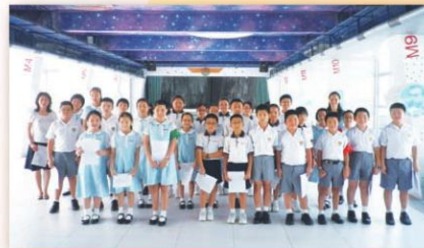
普通話宣傳大使樂意為同學服務，合力幫助同學增加說普通話的機會。