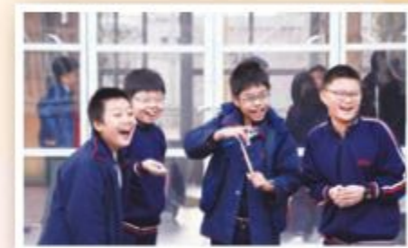
常識科技日的「衝天直昇機」讓同學在愉快的氣氛中學習。