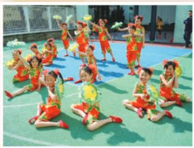
舞蹈精英 B 組在聖誕聯歡會中表演《氍毹轉》。