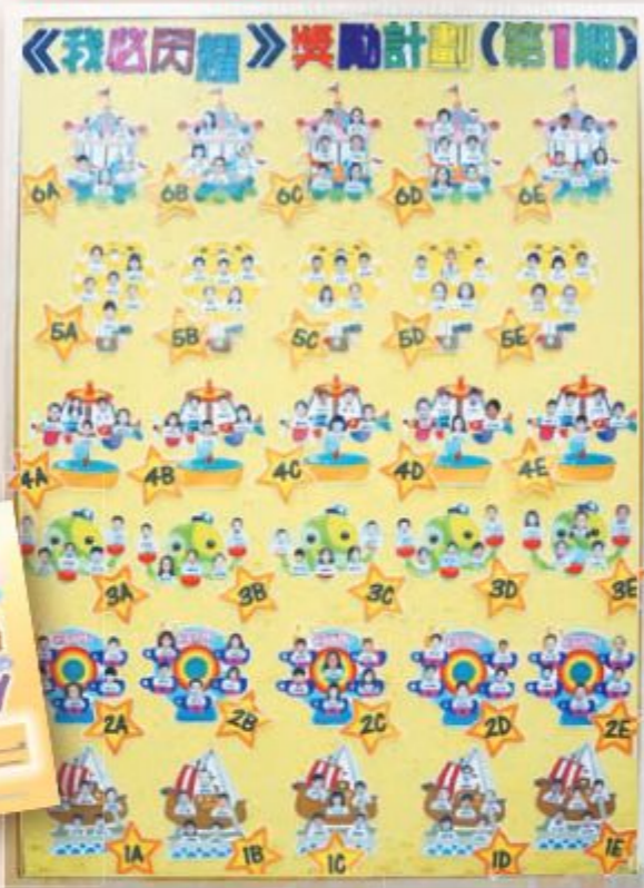
同學要在學業、音樂、體藝各範疇都有出眾的表現，才能榜上有名。