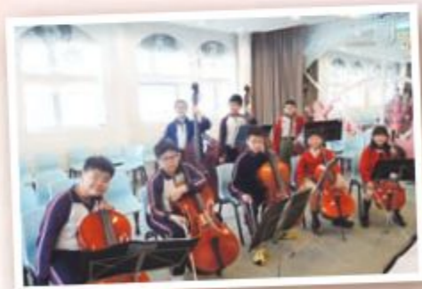
大提琴和低音大提琴班