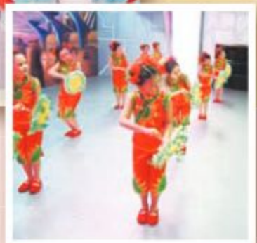
看看這四位舞蹈小精英得到不少舞蹈獎項。