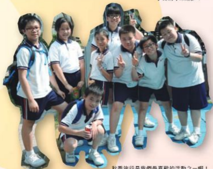
秋季旅行是我們最喜歡的活動之一啊！