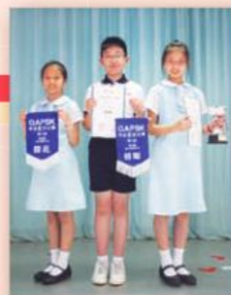
你看！狀元（圖右）、榜眼（圖中）、探花（圖左）獎項全在本校同學手