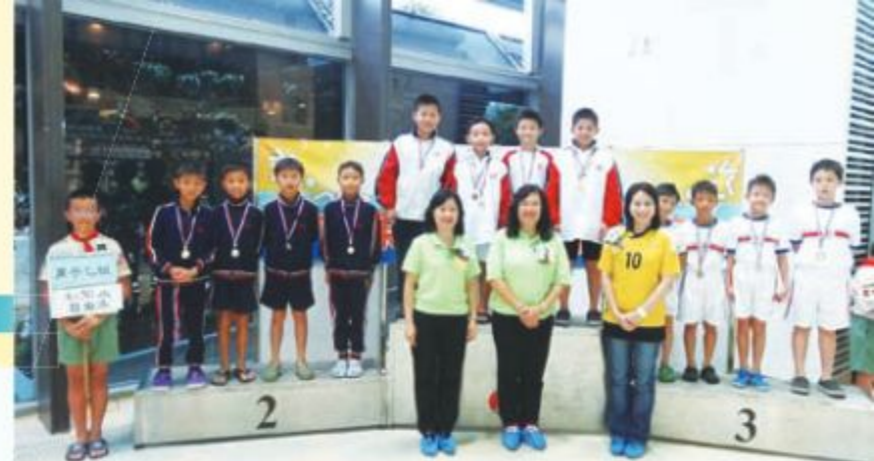
泳隊奪得男子乙組4×50米自由泳接力亞軍。