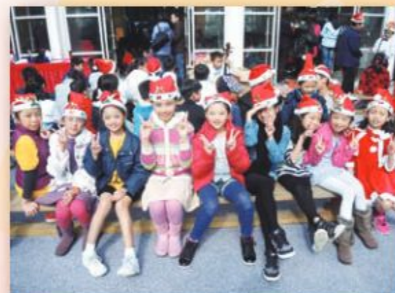
看！我們的衣著是否很有聖誕氣氛呢！