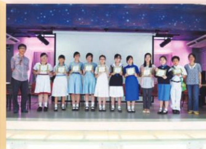
十分感謝師兄師姐們的分享。