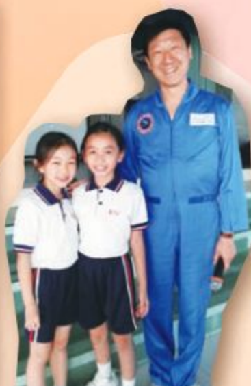
出席的同學和校友們都聽得津津有味，更成為了小粉絲囉！