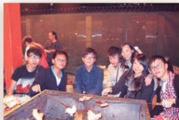
在老師心目中，你們仍是昔日的小孩子。