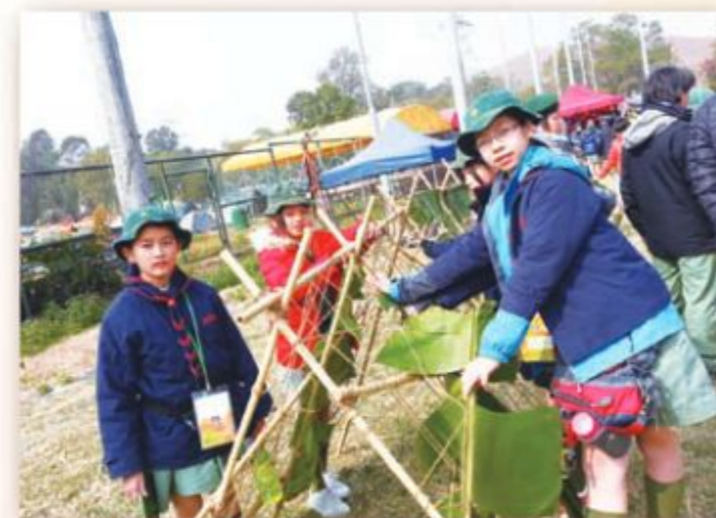
小小的製作工程是難不倒我們的 (金紫荊獎章考驗營)

除了能抵得住嚴寒，幼童軍過去一年亦參加了很多活動，得到不少佳績，例如取得 2013 年傑出旅團金獎。幼童軍在 2013 年的九龍地域錦標賽，亦得到小組最佳成績獎。A 團和 B 團的幼童軍在紅磡區會主席盾比賽，分