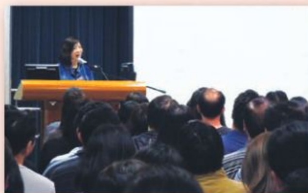
教師於家長天地中講解主題