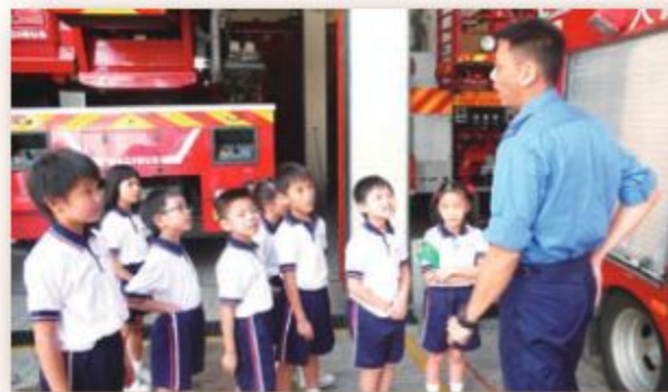
同學們細心地聆聽消防員的講解。