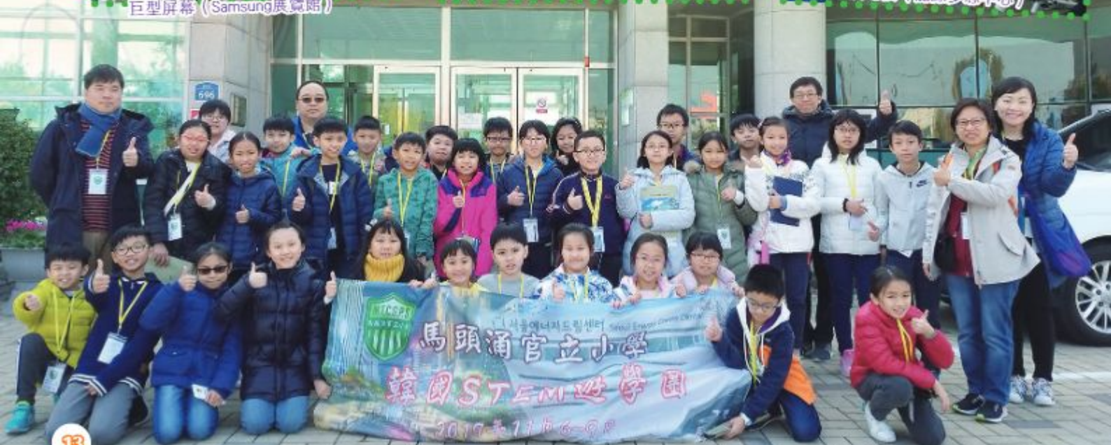
遊學團包括5位老師和32位學生。