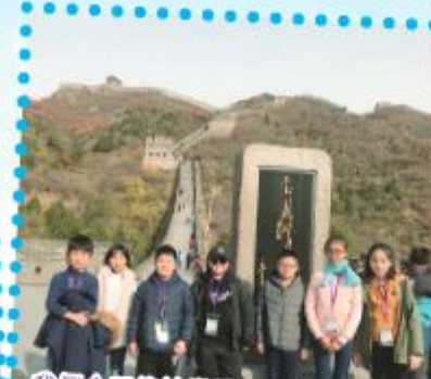
我們今天終於當了一回「好漢」！