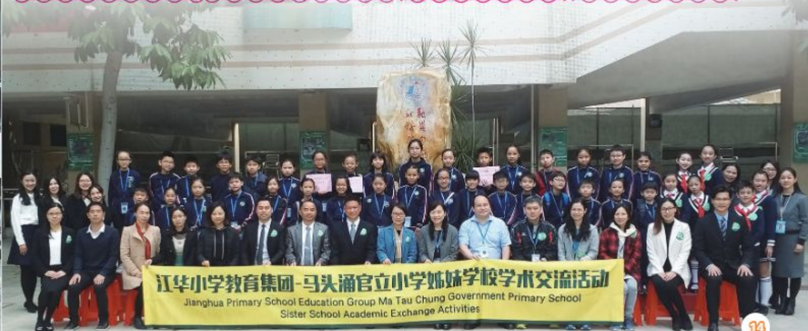
江華小學教育集團-馬頭涌官立小學姊妹學校學術交流活動 Jianghua Primary School Education Group Ma Tau Chung Government Primary School Sister School Academic Exchange Activities