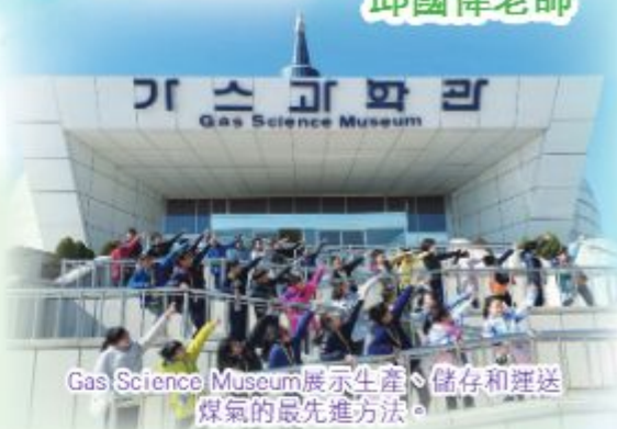
Gas Science Museum展示生產、儲存和運送煤氣的最先進方法。