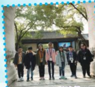
躍上龍門前的「鯉魚們」。

是次旅程不但讓我們認識了人類的起源、孔子的生平、古代的大學、北京人民的生活，更讓我們認識了我國近代的發展，擴闊了我們的視野。