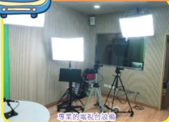
專業的電視台設備