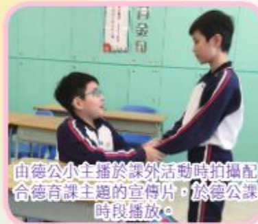
由德公小主播於課外活動時拍攝配合德育課主題的宣傳片，於德公課時段播放。