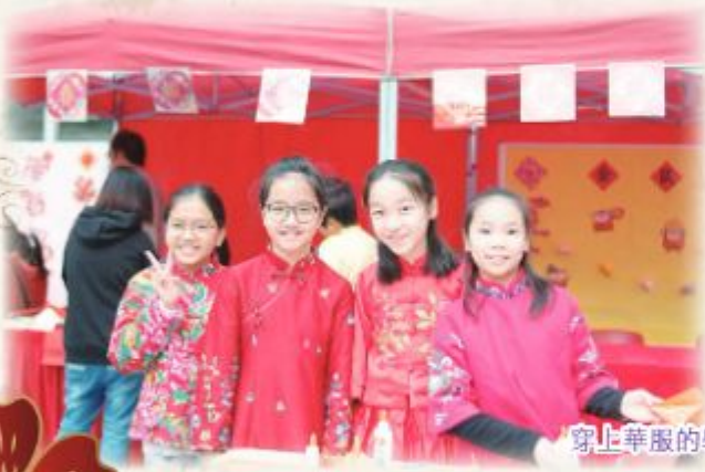
穿上華服的學生特別可愛。