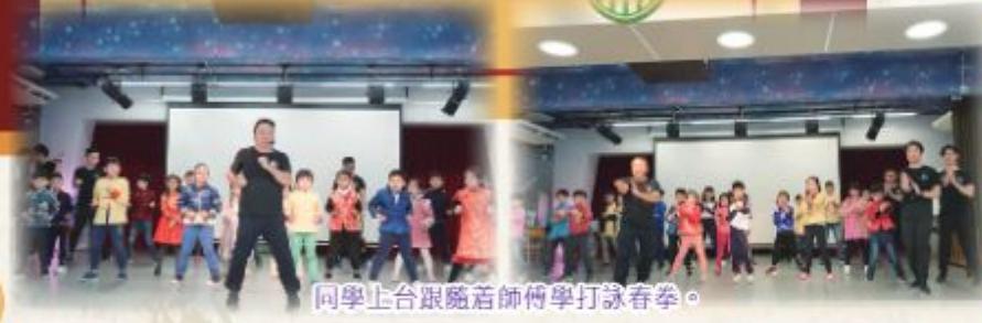
同學上台跟隨着師傅學打詠春拳。