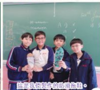
這是我們製作的防滑拖鞋。