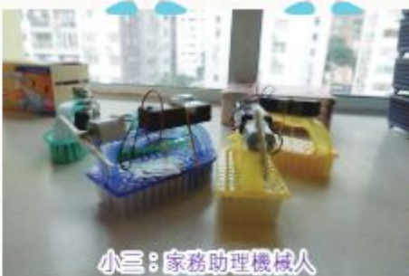
小三：家務助理機械人