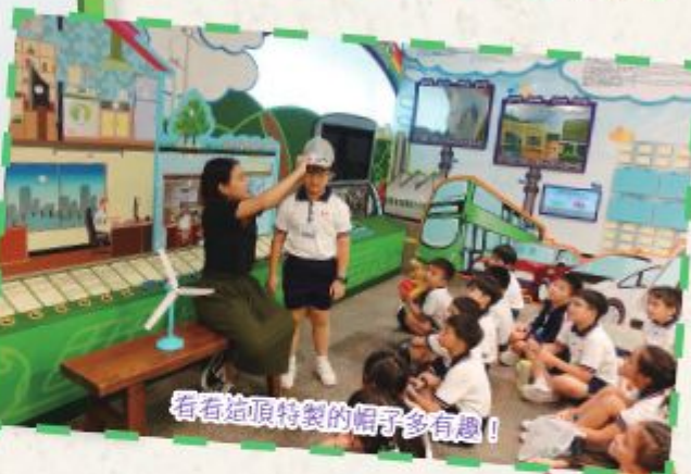
看看這頂特製的帽子多有趣！