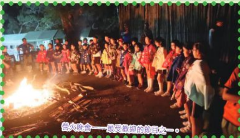
營火晚會——最受歡迎的節目之一。