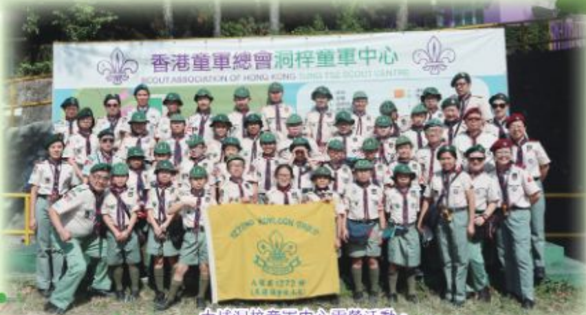
大埔洞梓童軍中心露營活動。