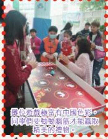
攤位遊戲極富有中國色彩，同學們要動動腦筋才能贏取精美的禮物。