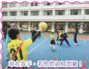
球在我手，看你們如何閃避！