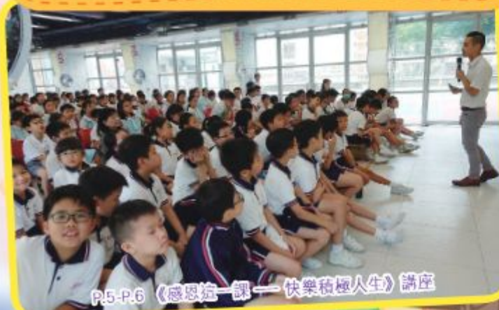
P.5-P.6 《感恩這一課——快樂積極人生》講座