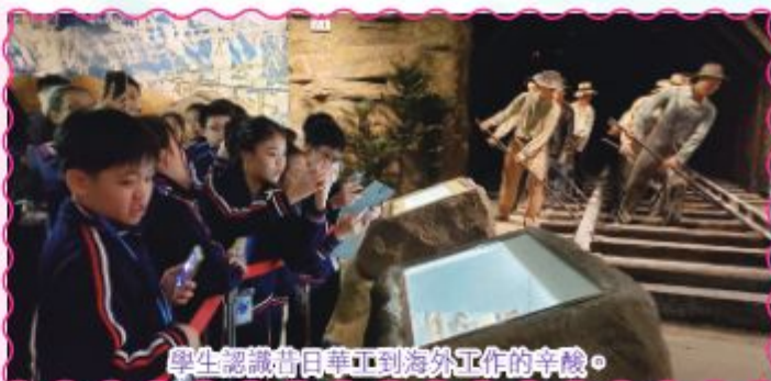
學生認識昔日華工到海外工作的辛酸。

過關後，我們參觀了五邑華僑華人博物館，認識了當年華工到海外艱辛創業以及回報家鄉的感人事迹；更參觀了開平自力村，認識了融會中西建築風格，集防洪、防盜及居住於一身的碉樓。