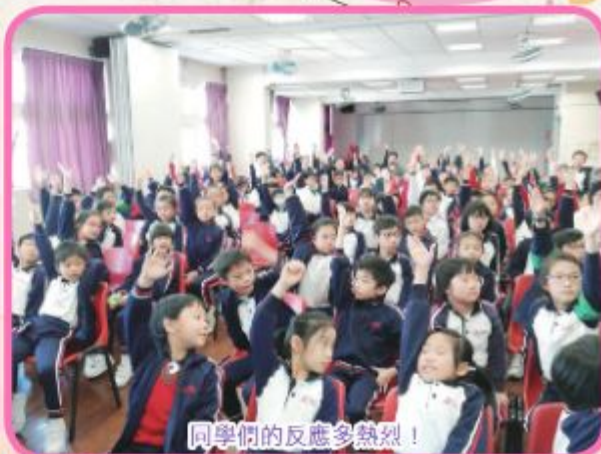
同學們的反應多熱烈！