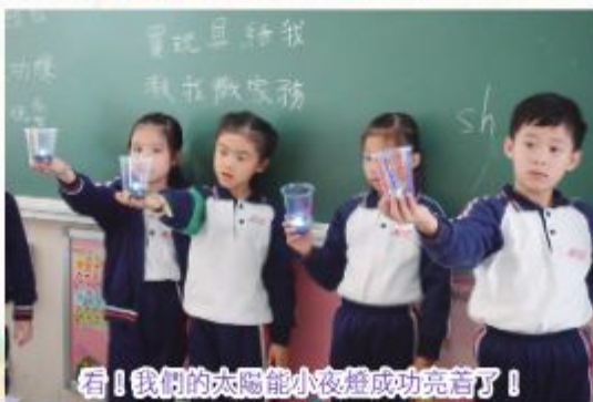
看！我們的太陽能小夜燈成功亮著了！