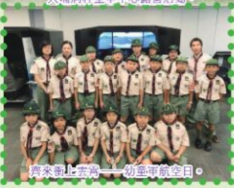
齊來衝上雲霄——幼童軍航空日。