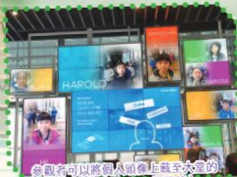
參觀者可以將個人頭像上載至大堂的巨型屏幕 (Samsung展覽館)