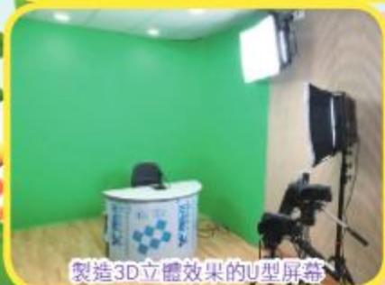
製造3D立體效果的U型屏幕