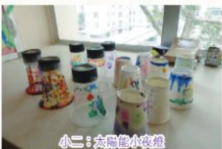
小二：太陽能小夜燈