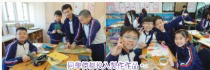
同學們都投入製作作品。