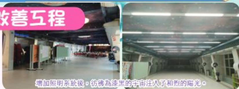
增加照明系統後，彷彿為漆黑的宇宙注入了和煦的陽光。