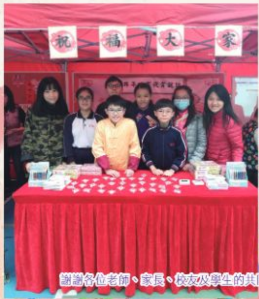
謝謝各位老師、家長、校友及學生的共同努力，讓同學們能享受到愉快的一天。