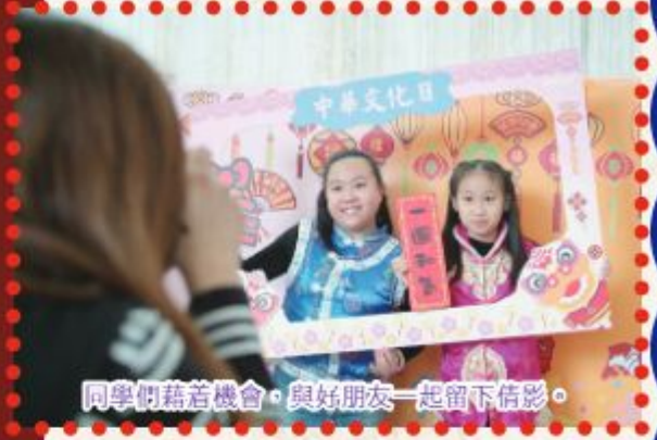
同學們藉着機會，與好朋友一起留下倩影。