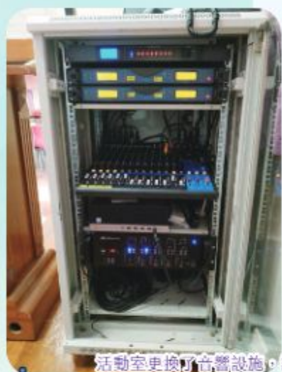
活動室更換了音響設施，讓講座、活動有更精彩的表現。

聖誕期間，我們更換了活動室的音響系統，讓在活動室進行的講座及活動有更精彩的表現。