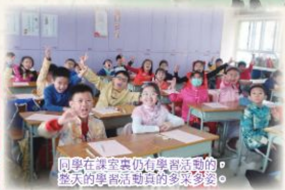
同學在課室裏仍有學習活動的，整天的學習活動真的多采多姿。