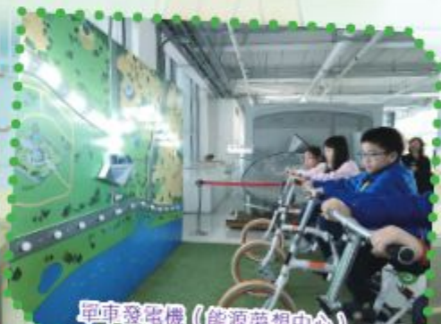
單車發電機 (能源夢想中心)