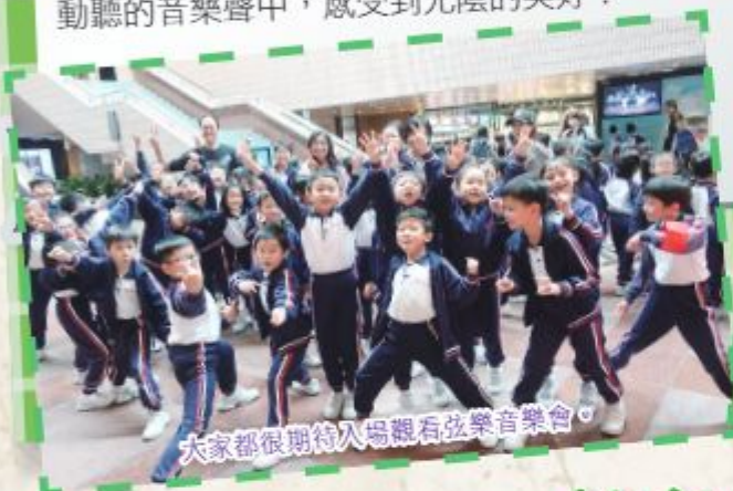
大家都很期待入場觀看弦樂音樂會。