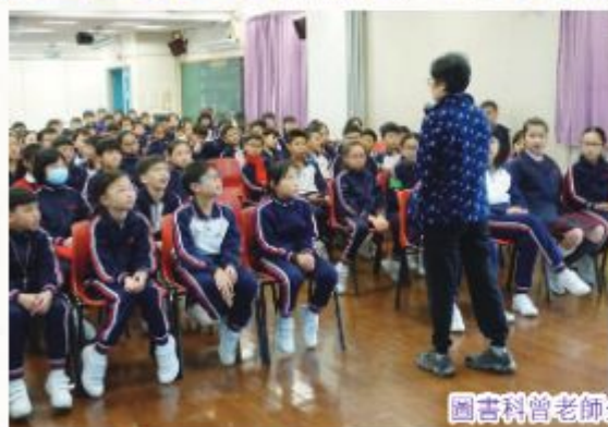
圖書科曾老師分享的故事很有趣味！