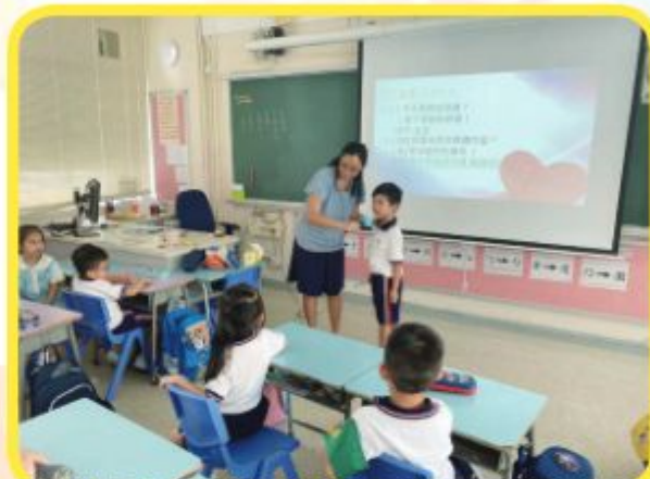
學生於成長課學習如何感恩及一同完成班本的感恩瓶子。