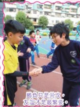
勝負只是其次，友誼才是最緊要。