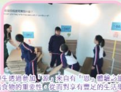
學生透過參加「源」來自「恩」體驗之旅，認識珍惜食物的重要性，從而對享有豐足的生活學會感恩。