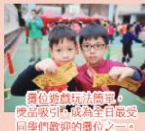
攤位遊戲玩法簡單，獎品吸引，成為全日最受同學們歡迎的攤位之一。