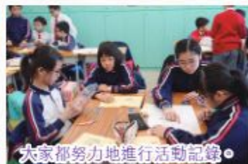
大家都努力地進行活動記錄。