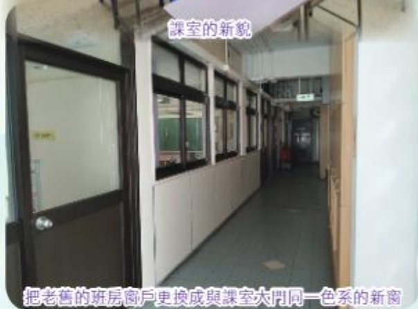
把老舊的班房窗戶更換成與課室大門同一色系的新窗