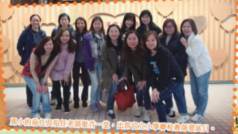
馬小的前任及現任老師聚首一堂，出席官立小學聯校教師發展日。