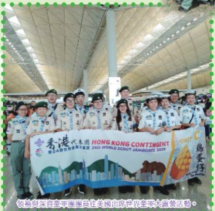
領袖與深資童軍團員往美國出席世界童軍大露營活動。