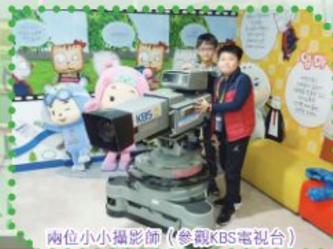
兩位小小攝影師 (參觀KBS電視台)