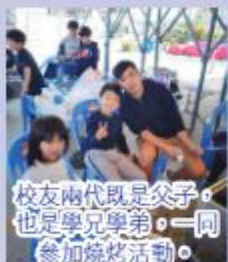
校友兩代既是父子，也是學兄學弟，一同參加燒烤活動。