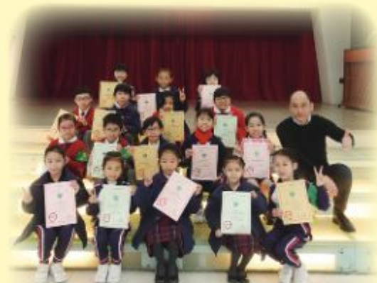
英文硬筆書法比賽得獎同學