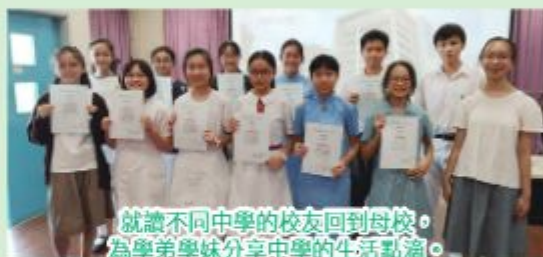
就讀不同中學的校友回到母校，為學弟學妹分享中學的生活點滴。

六年級同學完成畢業試後，面對升中的困惑便愈來愈大，校友會為他們舉辦「我和師兄師姐有個約會」分享會，邀請來自不同中學的師兄師姐分享他們中學的校園生活。