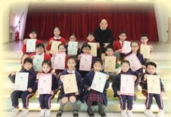
中文硬筆書法比賽得獎同學