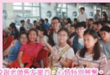
校友們回到母校跟老師舊友聚首，心情特別興奮。

第九屆會員周年大會於11月2日上午舉行。畢業於不同年份的校友們都紛紛回母校支持。