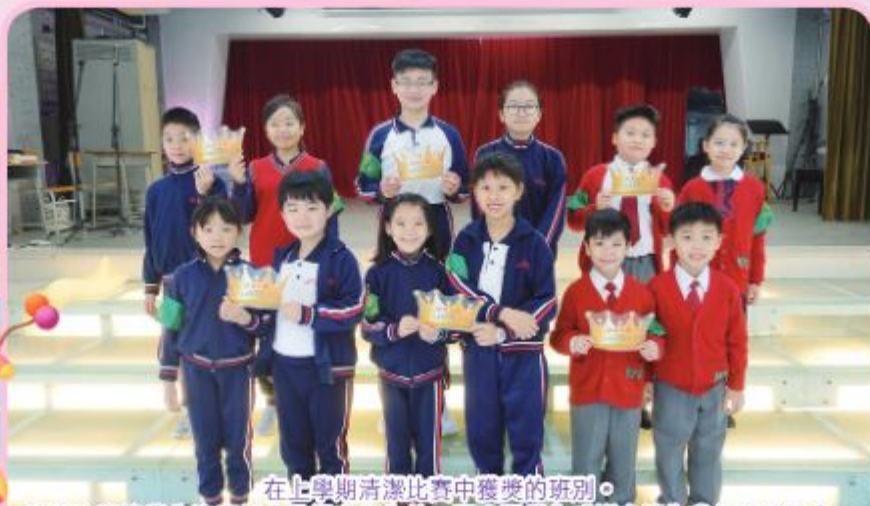
在上學期清潔比賽中獲獎的班別。清潔比賽讓學生注意個人及課室衛生外，更喚醒學生感謝身邊為我們服務的人。