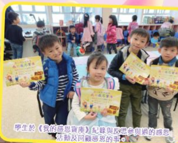
學生於《我的感恩寶庫》紀錄與反思參與過的感恩活動及回顧感恩的事。