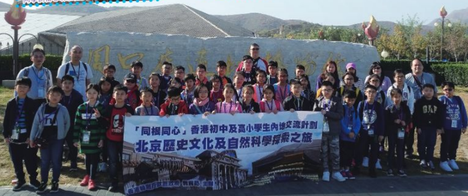
周口店遺址博物館前合照。