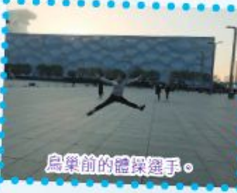
鳥巢前的體操選手。