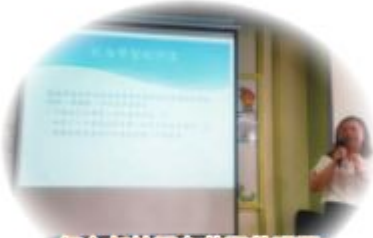
招主任於開心共聚教研間作分享如何促進學習的評估。

本年度官立小學聯校教師發展日已於2020年1月22日舉行，本年度的主題是「燃亮身心、關愛同行、凝聚力量、專業精神」。當天上午，教師分組到五間官立小學參與了官立小學專題及課程分享，下午全體老師到伊利沙伯體育館參加聯校教師發展日專題講座。大會請來香港大學首席副校長、香港大學經濟學講座教授王于漸教授為大家主講「以經濟學原理促進社會和諧」。同時，香港十大傑出青年、前亞洲攀岩錦標賽冠軍黎志偉先生主講「如何跨越逆境締造自強不息的生命力」。