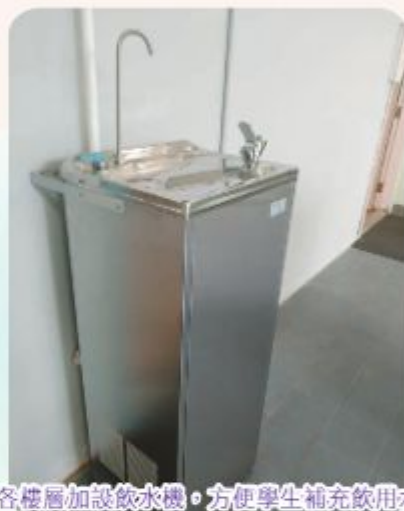
在各樓層加設飲水機，方便學生補充飲用水。

此外，在建築署及水務署的協助下，我們成功在各樓層加設飲水機，方便學生補充飲用水，培養健康的飲食習慣。