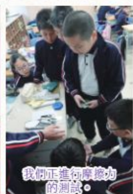
我們正進行摩擦力的測試。