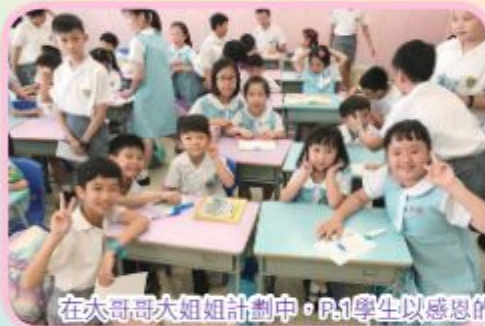
在大哥哥大姐姐計劃中，P.1學生以感恩的心來答謝照顧自己的P.6師兄師姐。