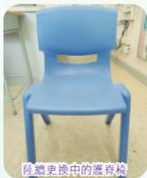
陸續更換中的護脊椅