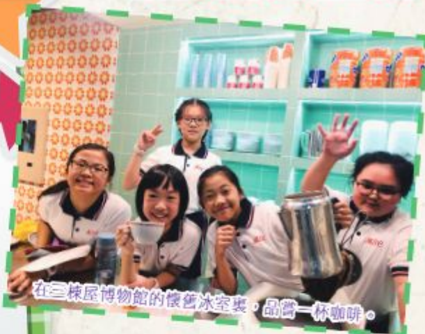
在三棟屋博物館的懷舊冰室裏，品嚐一杯咖啡。

「猶如在夢幻國」——這場音樂表演，以「多啦A夢」動畫主題曲結束，正好總結了我的感受。不同的管樂器像不同的法寶，一同奏出美妙的樂聲，有時如大江大海，有時如小鳥呢喃，有時如萬馬奔騰……使我們都沉醉在這動聽的音樂聲中，感受到光陰的美好！