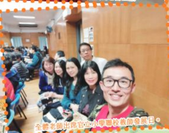
全體老師出席官立小學聯校教師發展日。