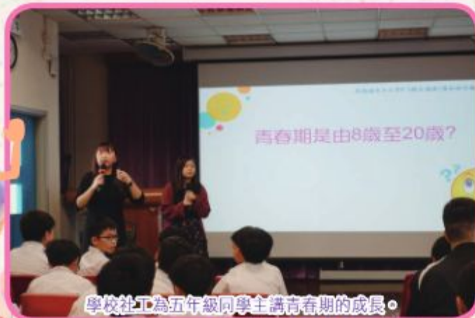
學校社工為五年級同學主講青春期的成長。