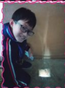
從地上的小洞，可清楚看到訪客的容貌。

充分休息了一晚後，我們第二天探訪了江華小學，同學們除了親身參與了立體人物雕塑課外，還與江華小學的同學們一起進行了兩校混合的閃避球友誼賽，當中互有勝負，通過互相合作，增進彼此的友誼。