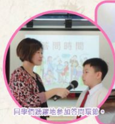
同學們踴躍地參加答問環節。