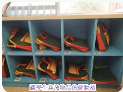
讓學生存放物品的儲物櫃