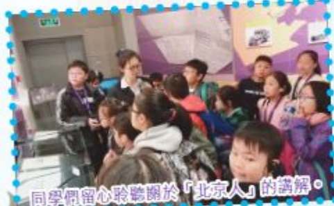
同學們留心聆聽關於「北京人」的講解。