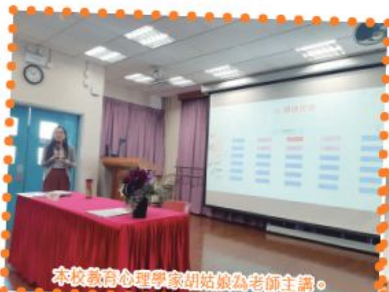
本校教育心理學家胡姑娘為老師主講。