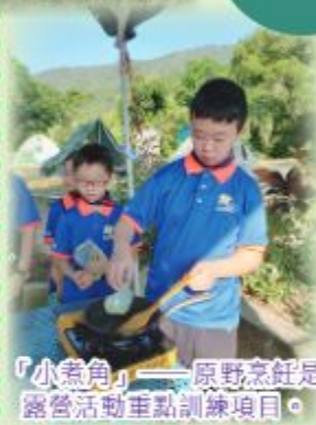
「小魚角」——原野烹飪是露營活動重點訓練項目。