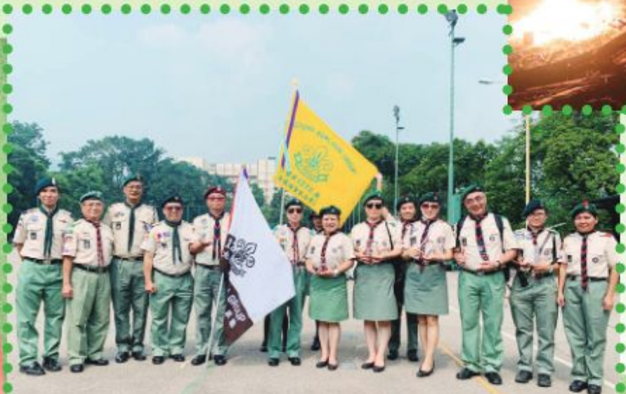
領袖出席傑出旅團頒獎禮（本旅幼童軍A、B、C、D四團都獲得金獎，而童軍團和深資童軍團各獲得銀獎，另有6位領袖獲得傑出領袖獎）。