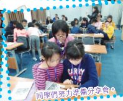
同學們努力準備分享會。