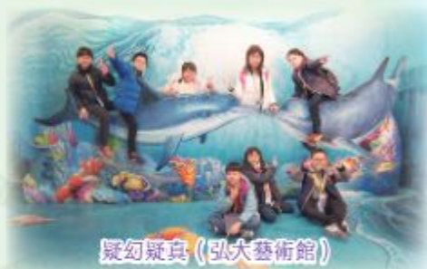
疑幻疑真 (弘大藝術館)