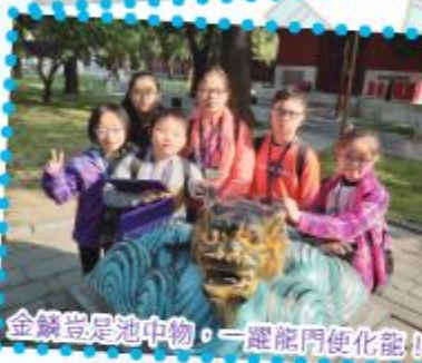
金鑊豈是池中物，一躍龍門便化龍！