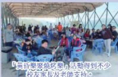
「黃昏樂聚燒烤樂」活動得到不少校友家長及老師支持。