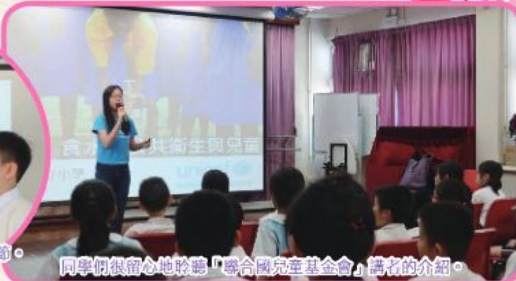
同學們很留心地聆聽「聯合國兒童基金會」講者的介紹。