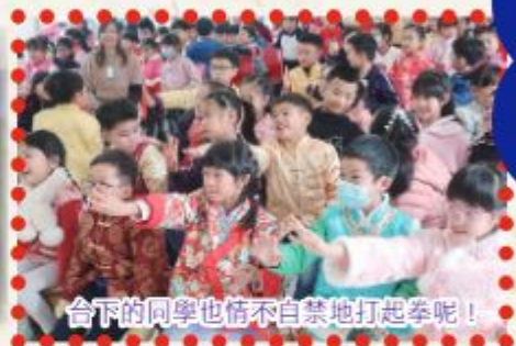
台下的同學也情不自禁地打起拳呢！