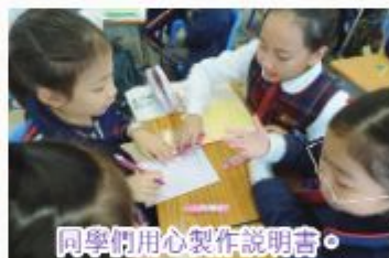
同學們用心製作說明書。