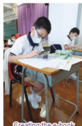
Creating the e-book