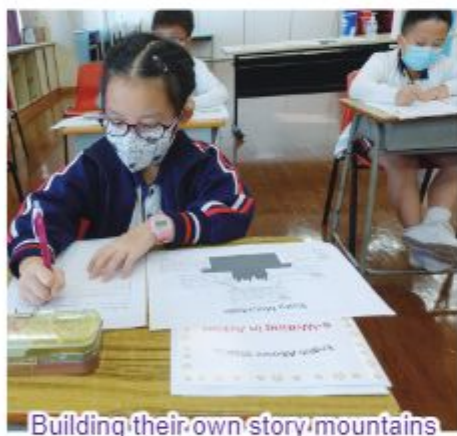
Building their own story mountains