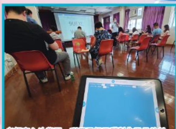
老師專心地學習，利用平板電腦製作電子教材。