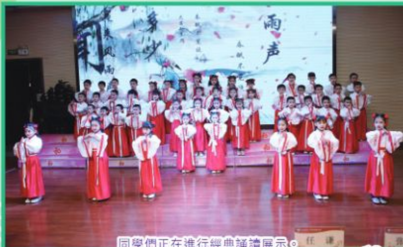
同學們正在進行經典誦讀展示。