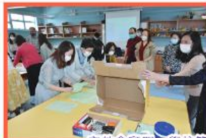
家教會顧問、學校管理委員會家長委員及老師進行點票及監票程序