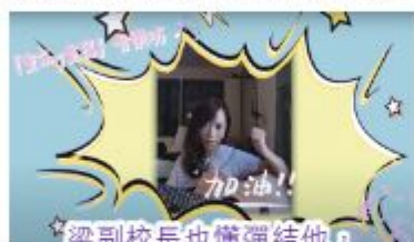
梁副校長也懂彈結他，在宣傳片為大家打打氣。