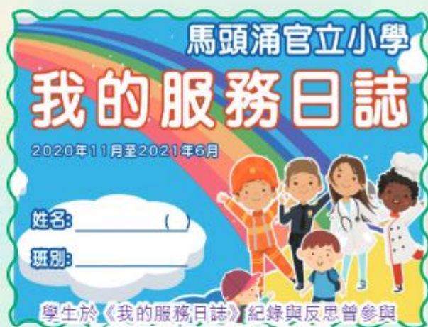
學生於《我的服務日誌》紀錄與反思曾參與的服務活動及回顧當中的學習。