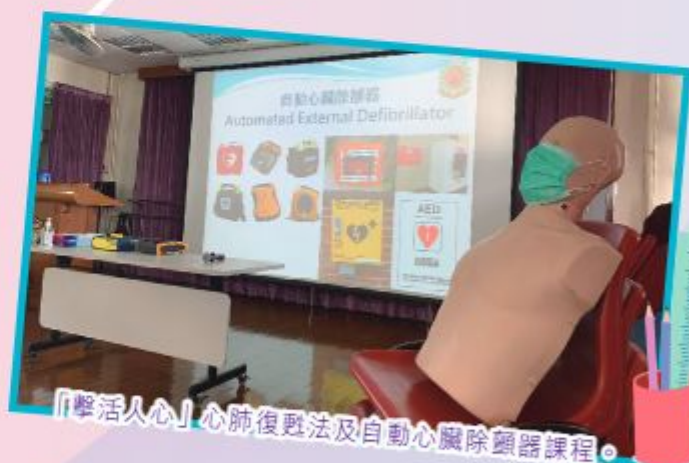
「擊活人心」心肺復甦法及自動心臟除顫器課程。