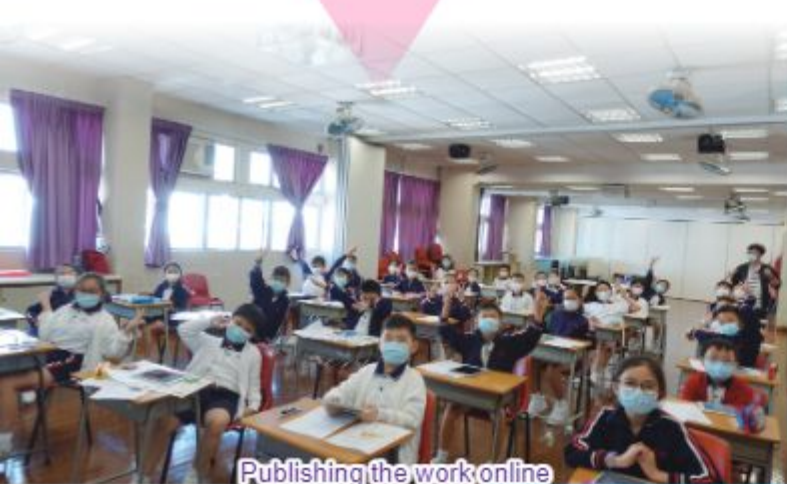
Publishing the work online