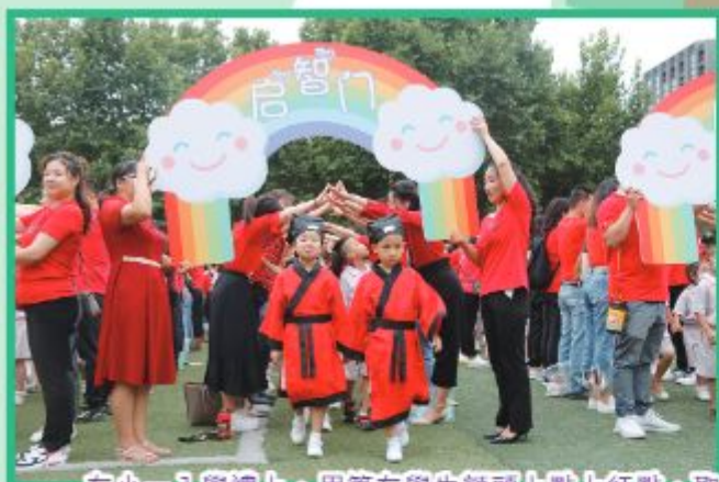
在小一入學禮上，用筆在學生額頭上點上紅點，取其開筆啟智之意，預示開學有好的開端，學習進步。