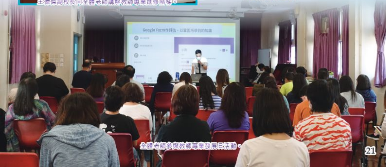
全體老師參與教師專業發展日活動。