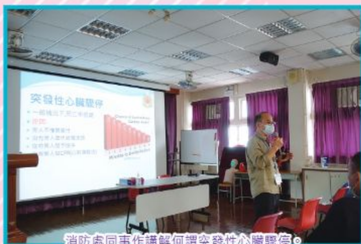
消防處同事作講解何謂突發性心臟驟停。