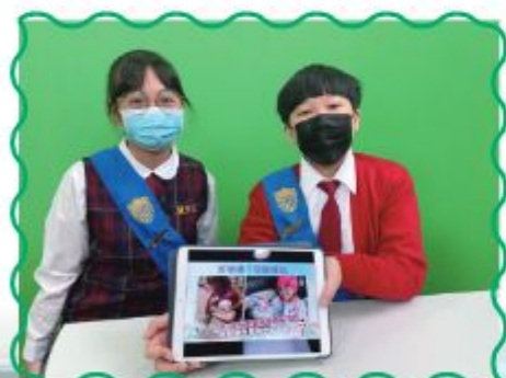
正向學生大使於Apps數碼校園電視台報導社會或校園內發生的好人好事。

為了提倡彼此服務的文化及營造關愛校園氣氛，全體師生一同參與「好事傳千里」廣播站計劃。由「正向學生大使」利用Apps數碼校園電視台，報導社會或校園內發生的好人好事，於校園內傳播欣賞及關愛的文化，同時讓同學明白「施比受更為有福」的道理，養成樂於助人的品格。