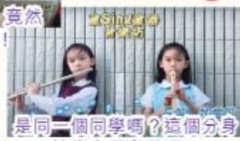
是同一個同學嗎？這個分身技術太厲害了吧。