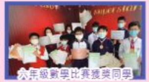
六年級數學比賽獲獎同學