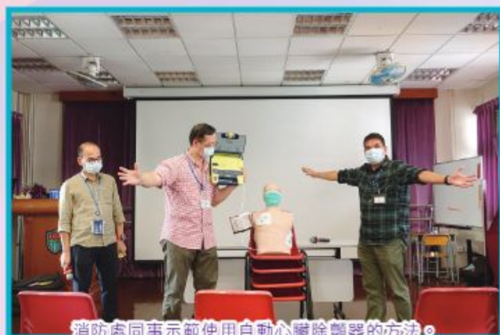
消防處同事示範使用自動心臟除顫器的方法。