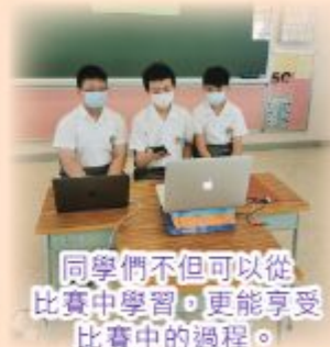
同學們不但可以從比賽中學習，更能享受比賽中的過程。