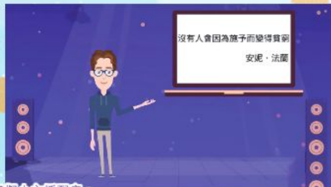
同學們落地地為虛擬小主播配音。