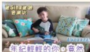
年紀輕輕的你，竟然如此有台型！