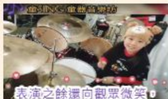
表演之餘還向觀眾微笑，這個造型實在太可愛了吧！