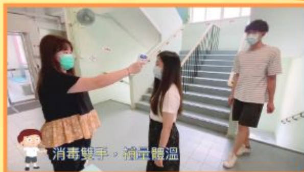
消毒雙手，測量體溫

我們透過全新落成的Apps數碼校園電視台，為學生製作影片，希望透過潛移默化的過程，提醒他們健康的重要性。