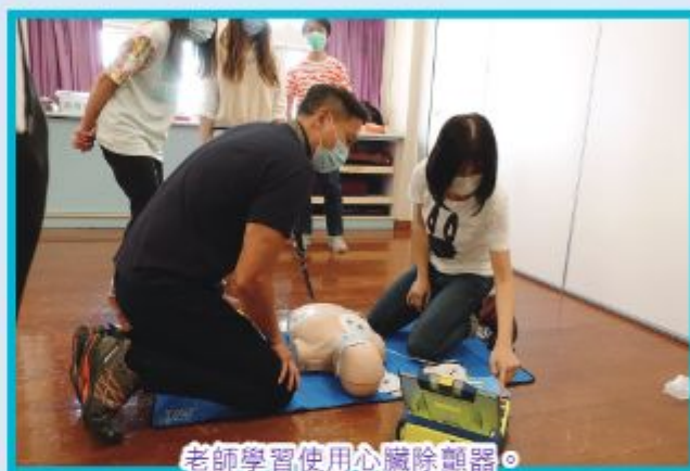
老師學習使用心臟除顫器。