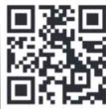
同學進行「我的服務行動承諾」的宣誓片段。