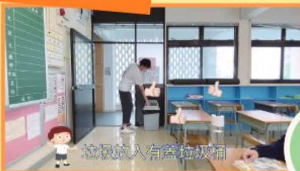
垃圾放入有蓋垃圾桶