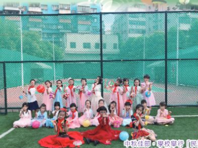
中秋佳節，學校舉行「民族團結一家親」系列活動，以增進學生對各民族文化的了解。