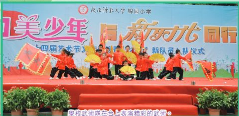
學校武術隊在台上表演精彩的武術。