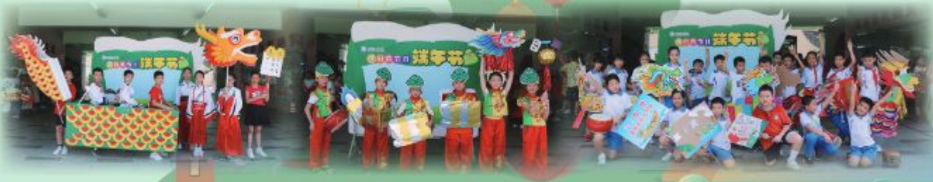
端午節，江華小學讓學生設計龍舟，並通過一系列活動，讓學生明白端午節的由來和習俗。