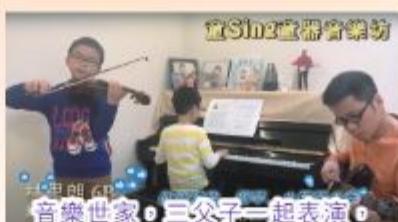
音樂世家，三父子一起表演，還增進了不少感情呢！