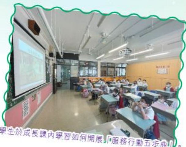
學生於成長課內學習如何開展「服務行動五步曲」。