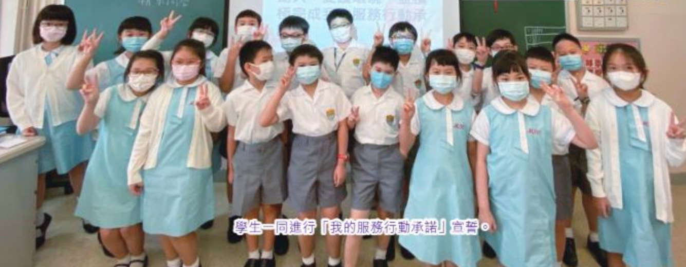
學生一同進行「我的服務行動承諾」宣誓。