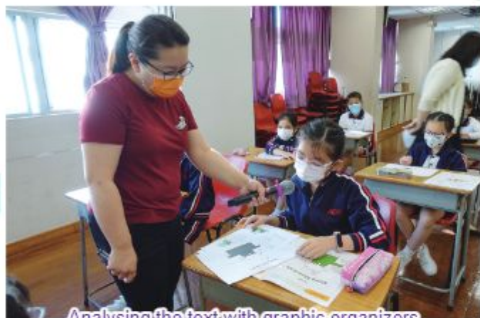
Analysing the text with graphic organizers