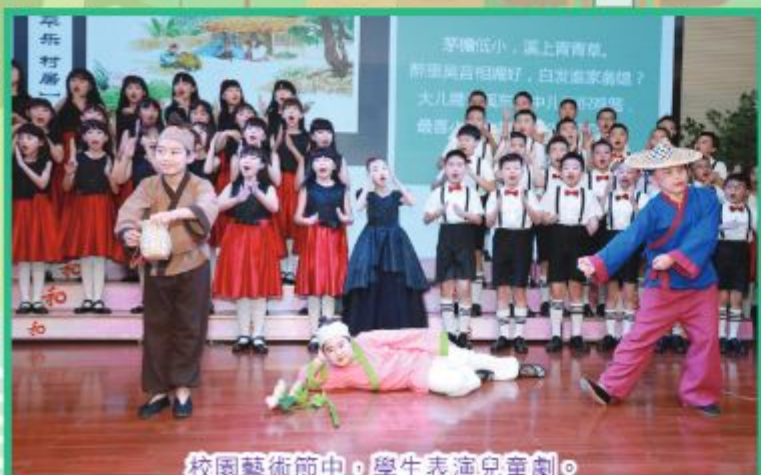
校園藝術節中，學生表演兒童劇。