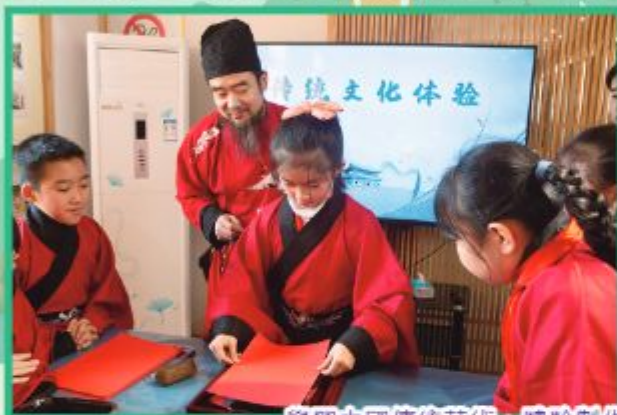
學習中國傳統藝術，體驗製作木板年畫及製作麩粉花。