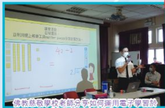
佛教慈敬學校老師分享如何運用電子學習於「作為學習的評估」。