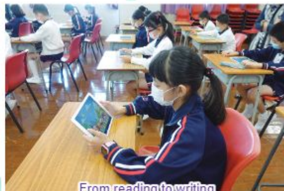
From reading to writing

30 Primary 4 students joined the two-day writing programme organized by the Chinese University of Hong Kong and SCOLAR. Participants were able to develop their writing skills through self-regulated writing strategies and e-Learning resources. Feeling inspired, they finally created their writing and published the work using Book Creator, an interactive book publishing application on electronic devices.