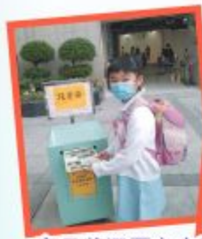
家長將選票交由孩子帶回學校進行投票

我們相信家長們積極參與學校的活動，能有助促進家教會會務的發展。本屆共有18位家長參選「常務委員」，其中12位家長當選成為新一屆的家教會常務委員。