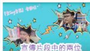
宣傳片段中的兩位小演員表情十足。