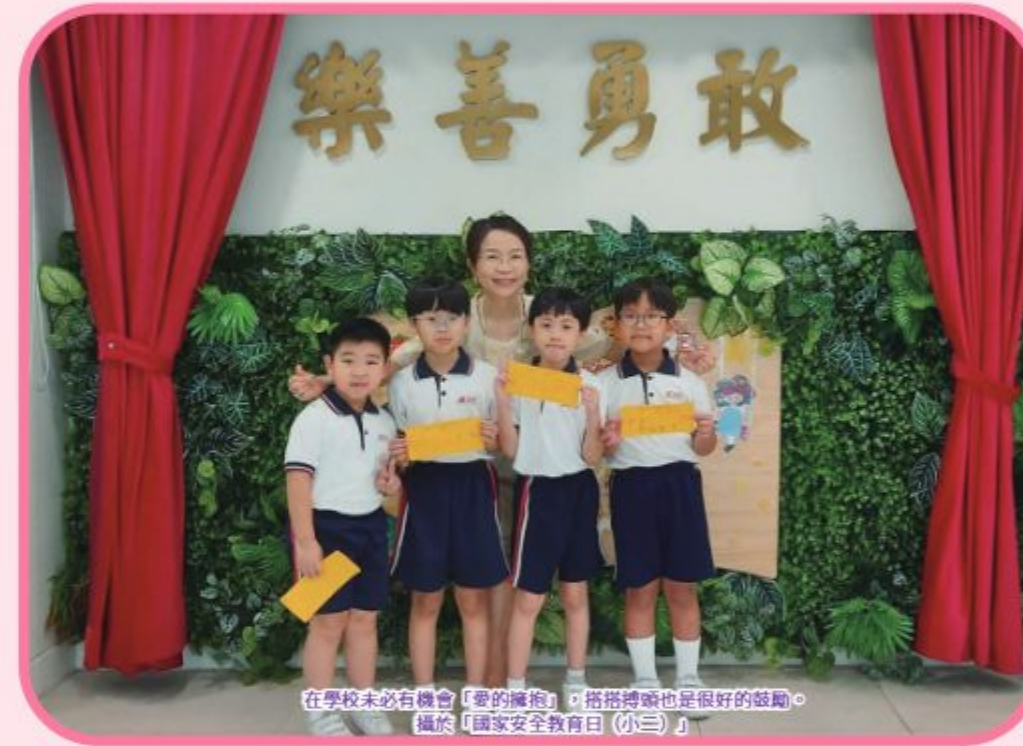
在學校未必有機會「愛的擁抱」，抱抱媽媽也是很好的鼓勵。攝於「國家安全教育日(小三)」。

各位老師、同學，有沒有習慣與家人「愛的擁抱」呢？歡迎大家在學校與我碰面時，與我交流一下「愛的擁抱」的經驗及心得。